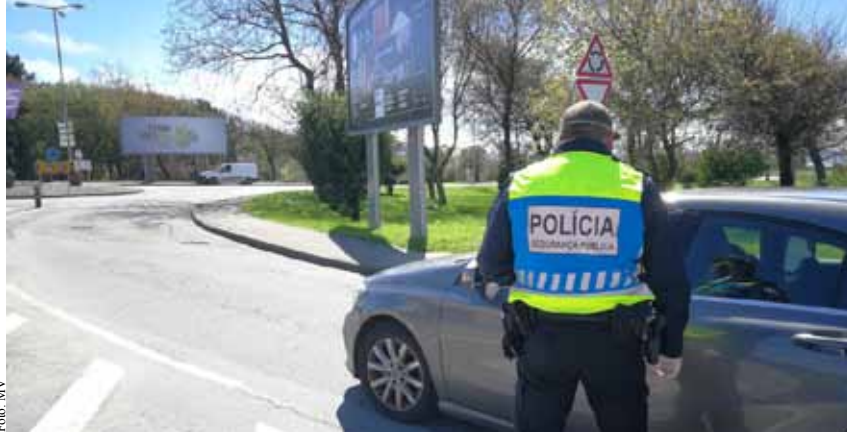
No sábado a PSP esteve a controlar quem atravessou os concelhos.

A circulação entre concelhos também foi proibida durante o