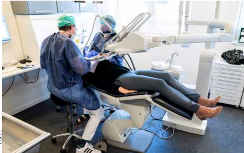
Apoio pode ser utilizado em consultas de dentista

A atribuição de 20 mil euros faz parte de um fundo existente desde 2015, “que disponibiliza um apoio financeiro excecional a agregados familiares carenciados que residam no concelho para fazer face a despesas de saúde na área de estomatologia e/ou de oftalmologia, enquanto especialidades médicas para as quais não existem respostas adequadas e suficientes no âmbito do