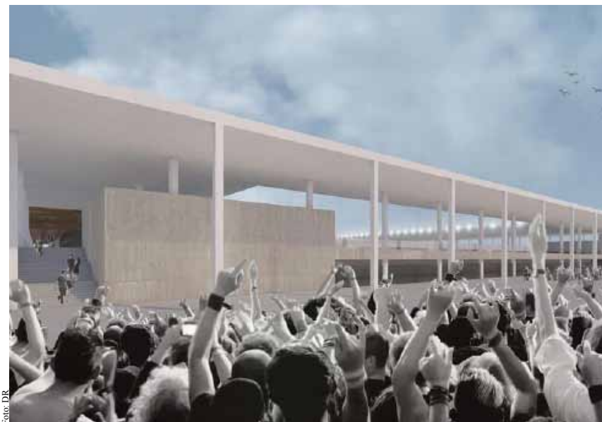
Imagem virtual do futuro estádio municipal de Espinho

de execução de 660 dias, foi adjudicada em julho de 2020 por 4,47 milhões de euros, um valor que será suportado pela autarquia através de um empréstimo bancário de 1,8 milhões de euros e o restante através do orçamento camarário.