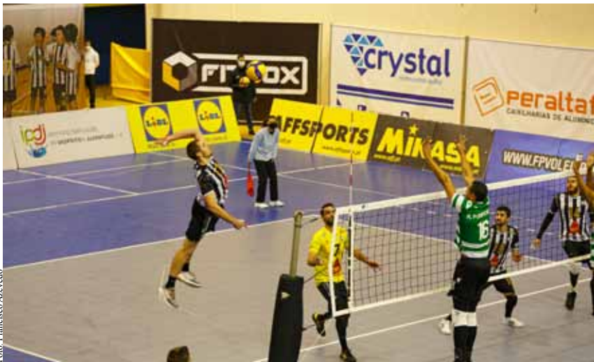
Sp. Espinho perdeu por 1-3 com o Sporting no dia 6 de janeiro.