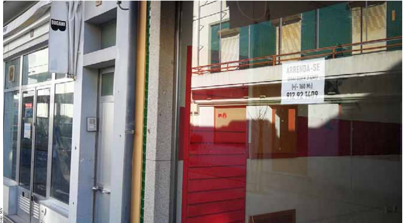
O ano que passou foi muito duro para alguns comerciantes que não resistiram e fecharam portas.

Com o concelho, o país e o mundo parados, o tempo quente co-