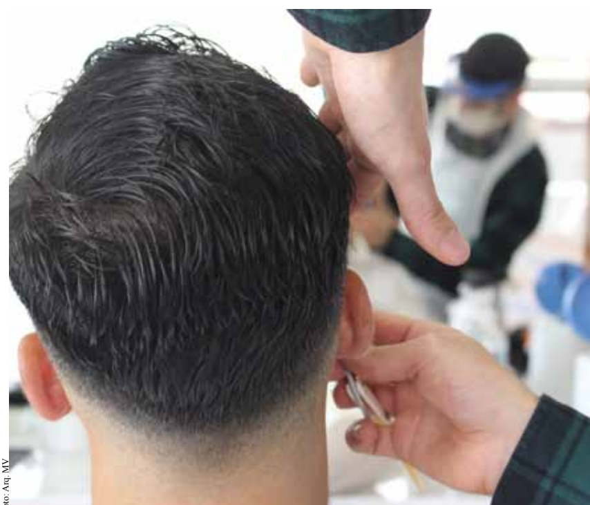
Cabeleireiros estão encerrados desde 15 de janeiro

Numa lógica de quem não tem cão caça com gato, numa simples pesquisa num site de anúncios, é possível verificar que há muitos profissionais da área que vendem os seus serviços com deslocações ao domicílio. Segundo um comunicado da plataforma OLX, “o número de respostas a anúncios e as pesquisas relacionadas com este sector cresceram significativamente entre a primeira quinzena de janeiro e a primeira quinzena de fevereiro. No que aos cabeleireiros diz respeito, as pesquisas aumentaram 70% da primeira para a segunda metade