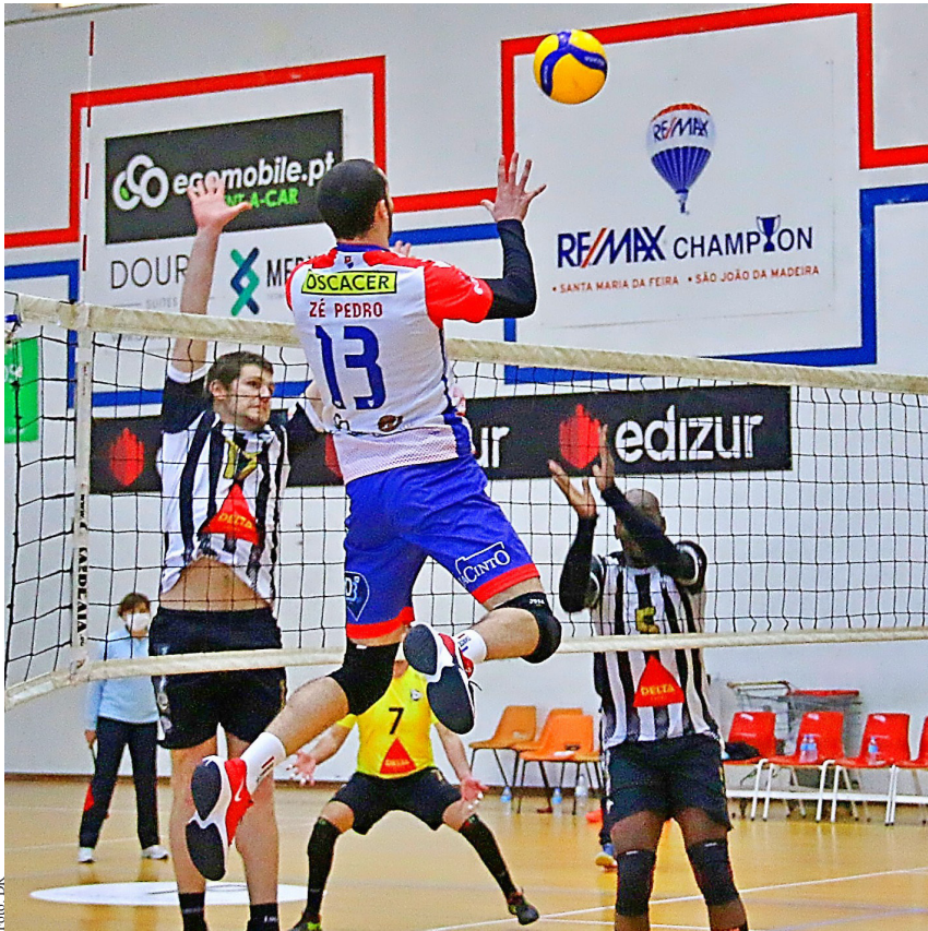
Sp. Espinho garantiu um lugar na luta pelo título