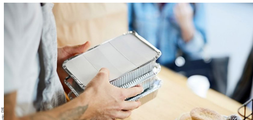
Refeições são distribuídas pelas pessoas identificadas como necessitadas