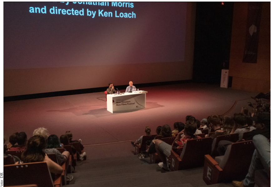
O FEST quer voltar ao Centro Multimeios e ao convívio com o público.

Composto pelas masterclasses , conferências e palestras do Training Ground , os espaços de encontro entre profissionais ( Industry Meetings ) e o Pitching Forum (espaço de formação e apoio a novos projectos), o Fest