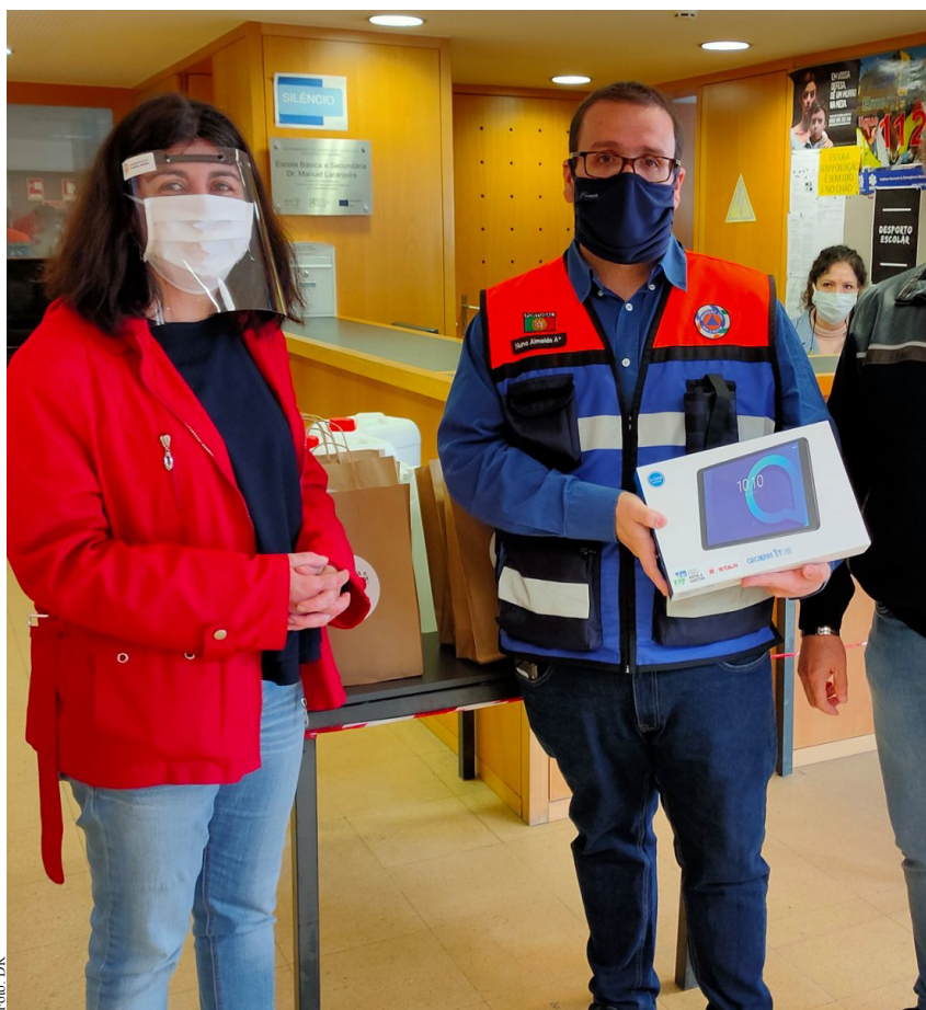
A União das Freguesias entregou tablets e hotspots ao Agrupamento de Escolas Dr. Manuel Laranjeira