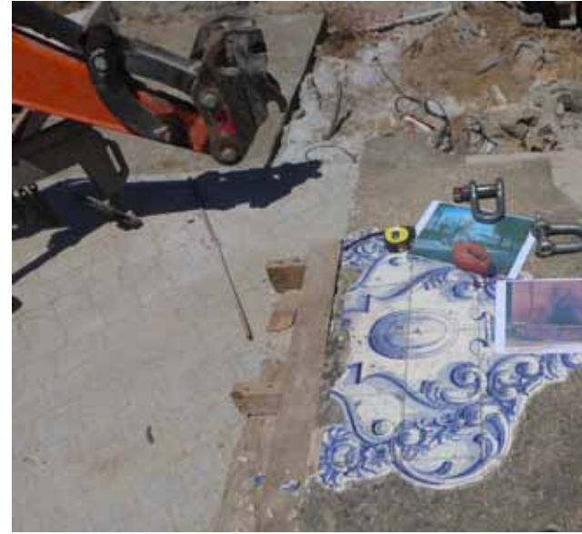
Foi necessário recorrer a fotografias antigas para

A nova Praça do Rio Largo ganhou uma nova cor, espaços verdes e até novos passeios. Contudo, a peça que mais se destaca, por questões de saudosismo, é o antigo fon-