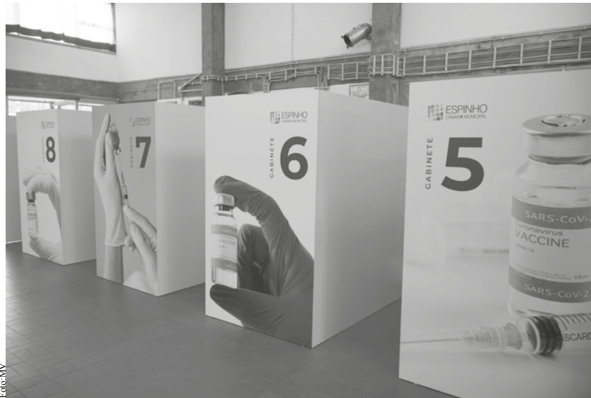
Já é possível o auto agendamento a partir dos 40 anos.

E há mais novidades na luta contra a pandemia. A Linha 1400 – Linha Nacional de Assistência