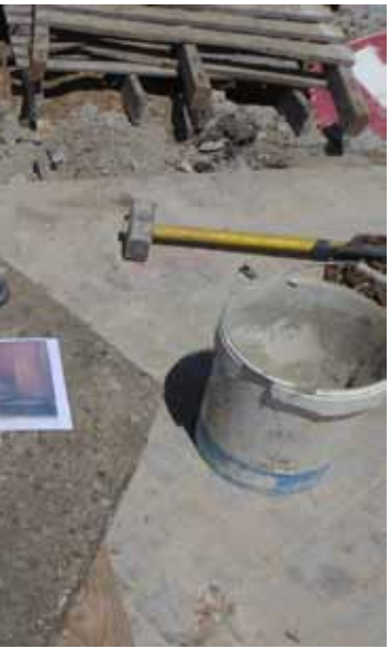
voltar a montar a peça.