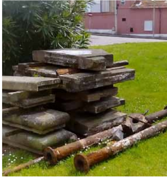
Antigo fontanário foi desmontado e esteve durante anos no jardim no Rio Largo.