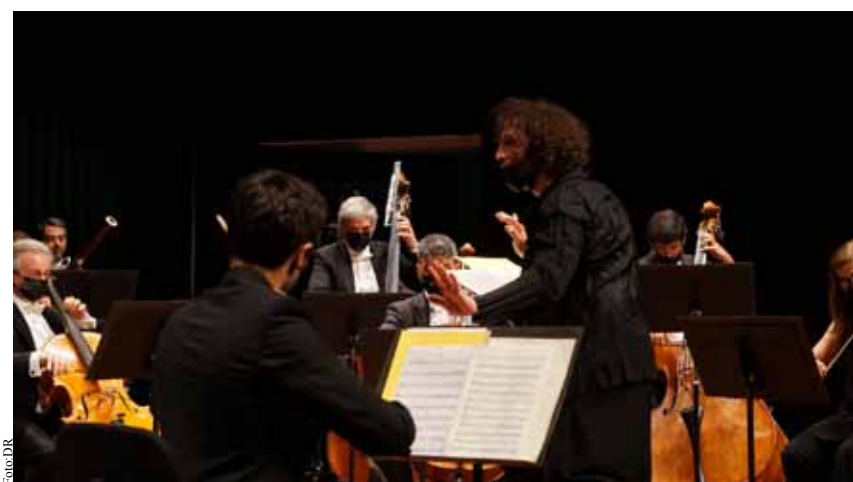
A Orquestra Gulbenkian e o violoncelista e maestro Nicolas Altstaedt fizeram as honras de abertura do FIME.

dado para dia 19 e torna a mudar de ares. "The Great Britten" é um recital inteiramente dedicado à música de Benjamin Britten, que