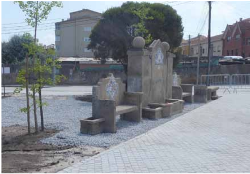
Fontanário já está operacional e foi inaugurado no Dia da Cidade.

ficou sempre a promessa por parte da autarquia que voltaria a ser montado na zona do Rio Largo. Durante vários anos as pedras e os azulejos estiveram ao aban-