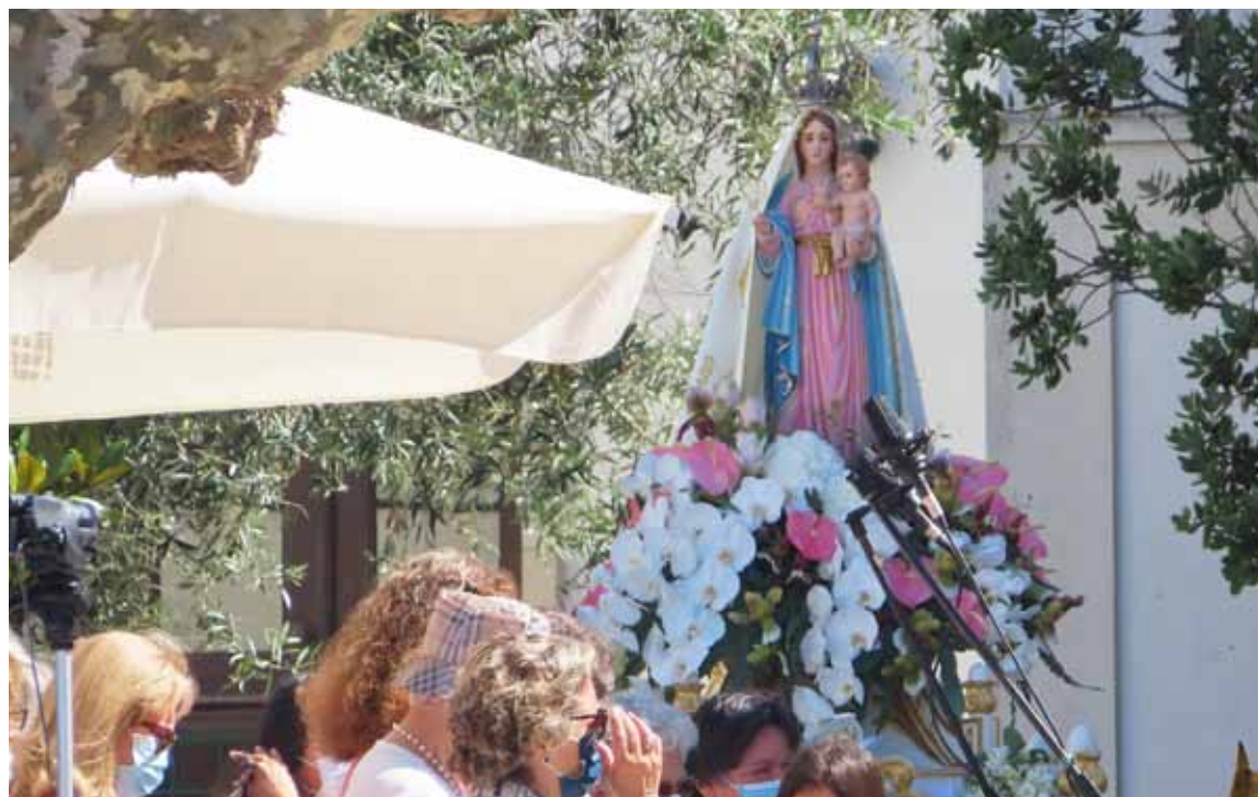
Eucaristia Solene em honra de Nossa Senhora da Ajuda foi realizada no domingo de manhã.