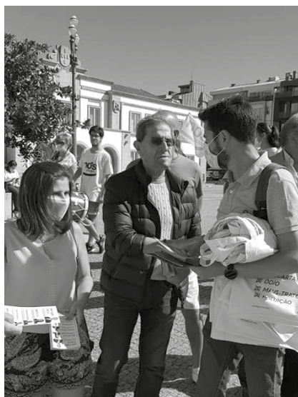
Nós Cidadãos também estiveram muito ativos nas ruas da cidade.

CDS-PP, BE e Nós também aproveitaram o fim-de-semana para realizar diversas campanhas nas principais vias da cidade. NO