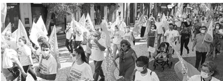
PS realizou uma arruada no sábado de manhã.