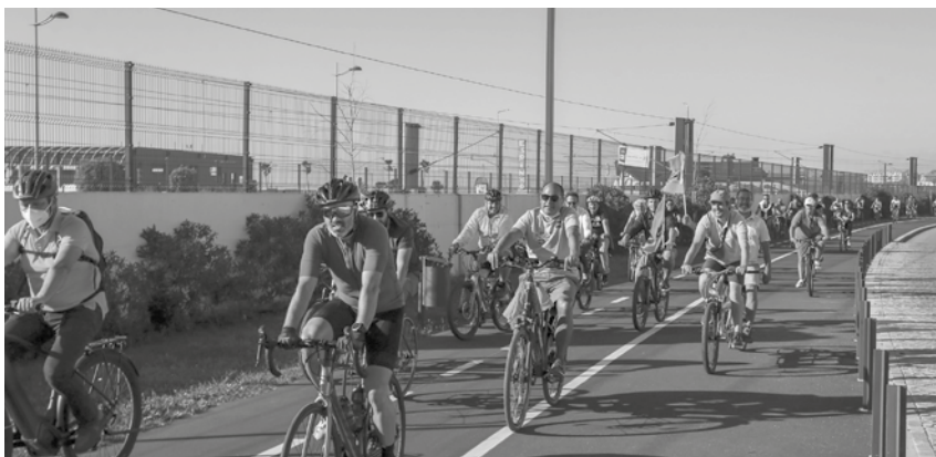
PSD organizou um passeio de bicicleta nas novas ciclovias.