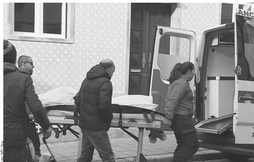
Momento em que os bombeiros recolheram os cadáveres das duas bebés recém-nascidas.

A mulher responde por dois crimes de homicídio qualificado