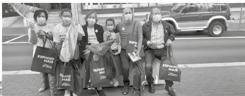
CDS-PP em campanha pelas ruas de Espinho.