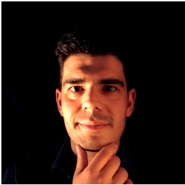
Tiago Afonso Violinista