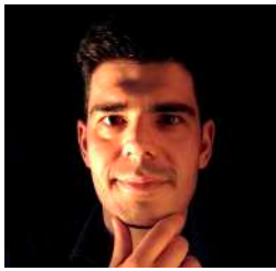
Tiago Afonso Violinista