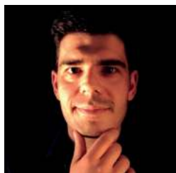
Tiago Afonso Violinista