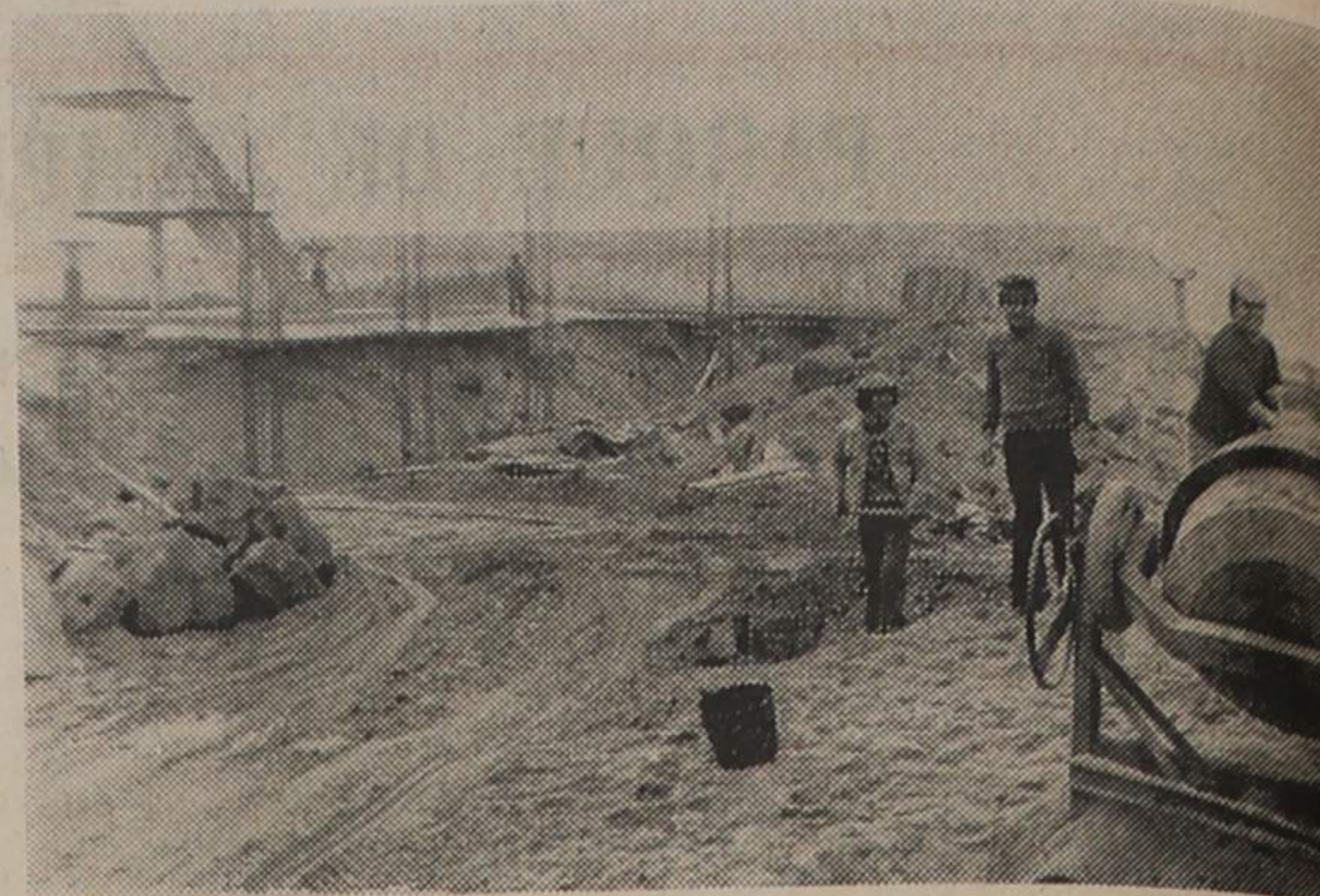
Um aspecto dos trabalhos de construção da estação de Talassoterapia

Joaquim Rocha revelou-nos ainda que «o balneário marinho engloba os duches, sauna, faugoterapia, banhos quentes e de imersão e outros tratamentos relacionados com hidroterapia, exercícios, massagens, serviços de enfermagem, etc.». Quanto ao tanque, «deverá ter dez por vinte metros».