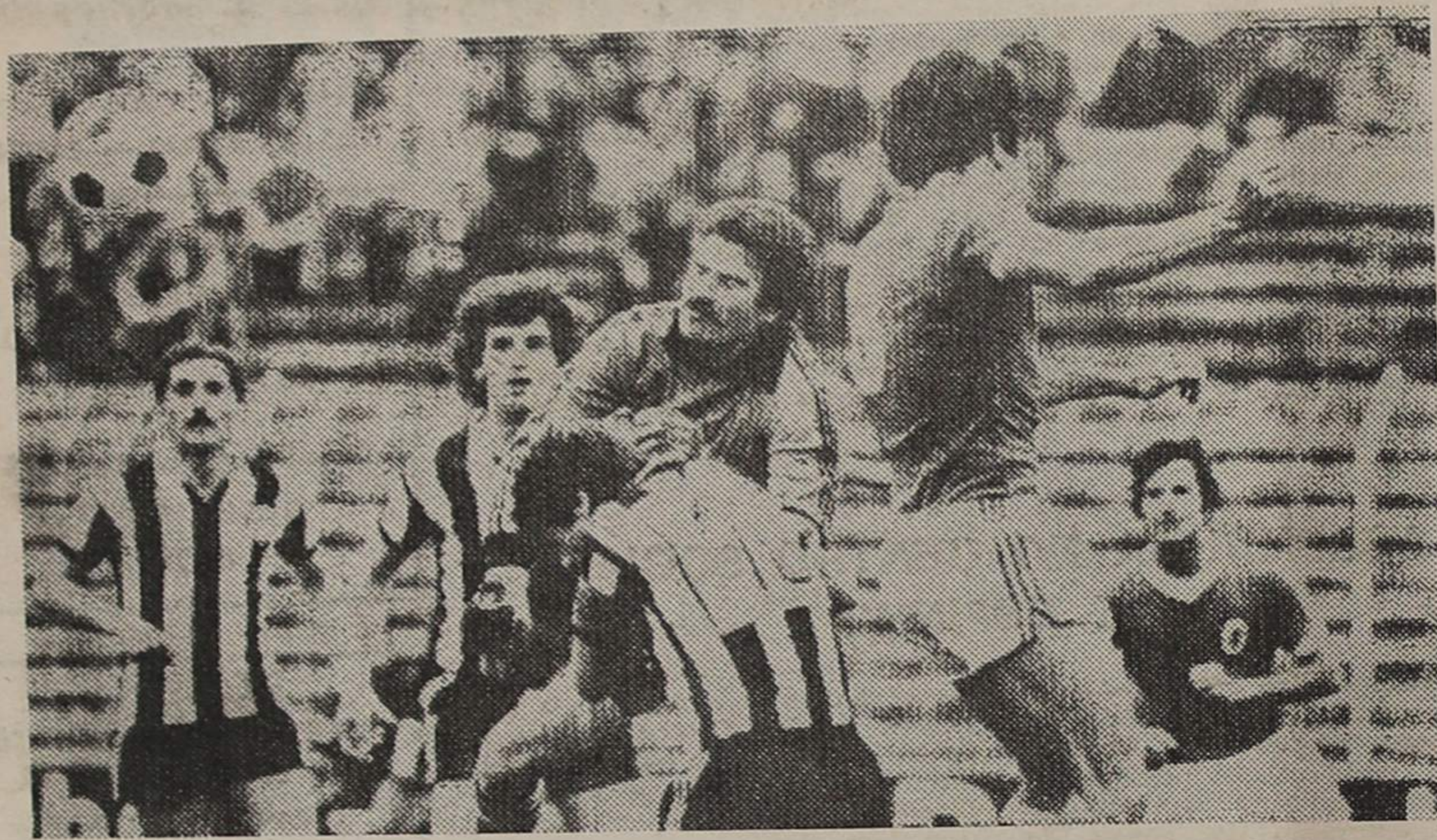
Espinhenses em apuros foram uma constante da primeira parte. No entanto, no segundo tempo foram os benfiquistas que passaram por momentos idênticos

Nos derradeiros quarenta e cinco minutos, foi Manuel José quem jogou a inteligentíssima cartada, de mandar entrar Canavaro para a frente do ataque, em troca com a passividade de Reis. João Carlos