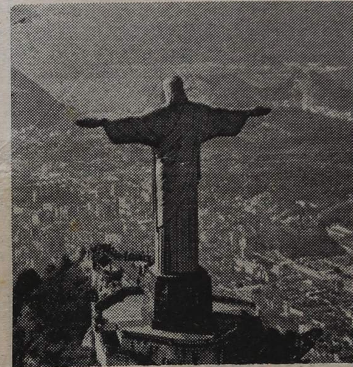
Rio de Janeiro, cidade onde os espinhenses têm uma casa própria

Manuela Aguiar, sempre que ali vai, recomenda cuidados especiais na vigilância à imagem da padroeira, também ela receosa que a Santa possa vir a ter a