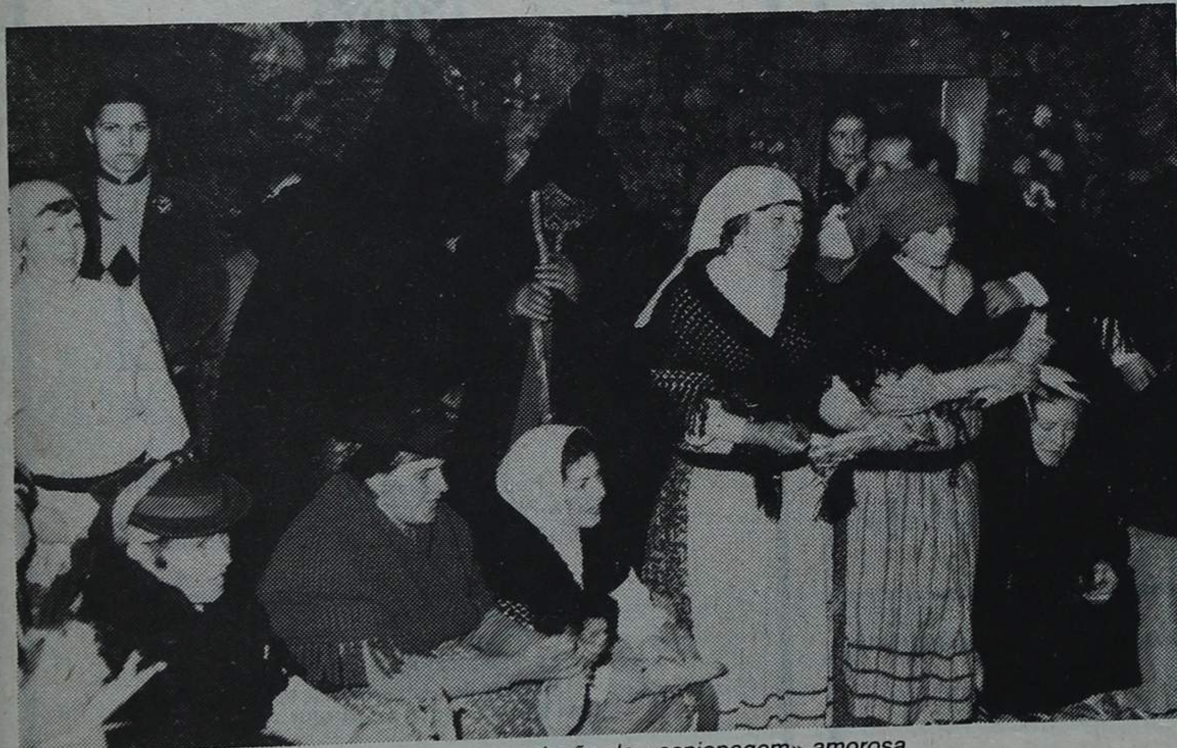
Os serandeiros em missão de «espionagem» amorosa

Aliás, nem só por isto os responsáveis do rancho de Nogueira da Regedoura se podem dar por satisfeitos: é que, segundo nos disse o presidente da Federação do Folclore, a continuar a trabalhar neste ritmo, o grupo de S. Cristóvão estará federado daqui a meio ano, passando, então, a ser considerado oficialmente como um dos genuínos intérpretes do folclore das Terras da Feira.