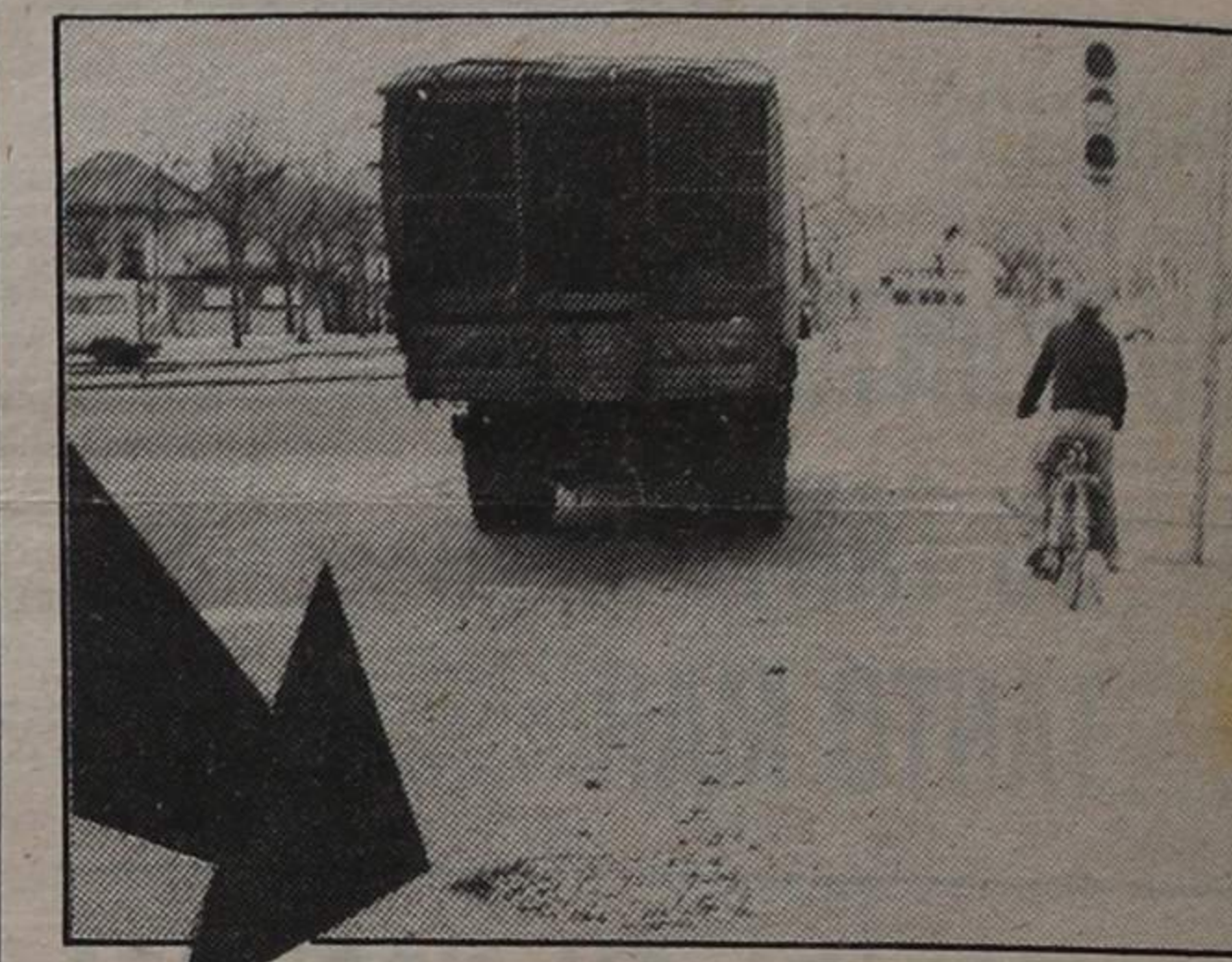
Na Rua 33, próximo do cruzamento com a Av. 24 que, como se vê, é regulada por sinalização automática. Um «senhor» buraco a strapelhar. Urge tapá-lo

Em Silvalde, a caminho do Monte de Paramos, as valetas mal limpas transformam a artéria num rio e, naturalmente, o pavimento começa a ficar esburacado. Para comodidade de quem lá passa e para conservação da artéria, bom seria que os serviços respectivos procedessem, pois, à limpeza dessas valetas.