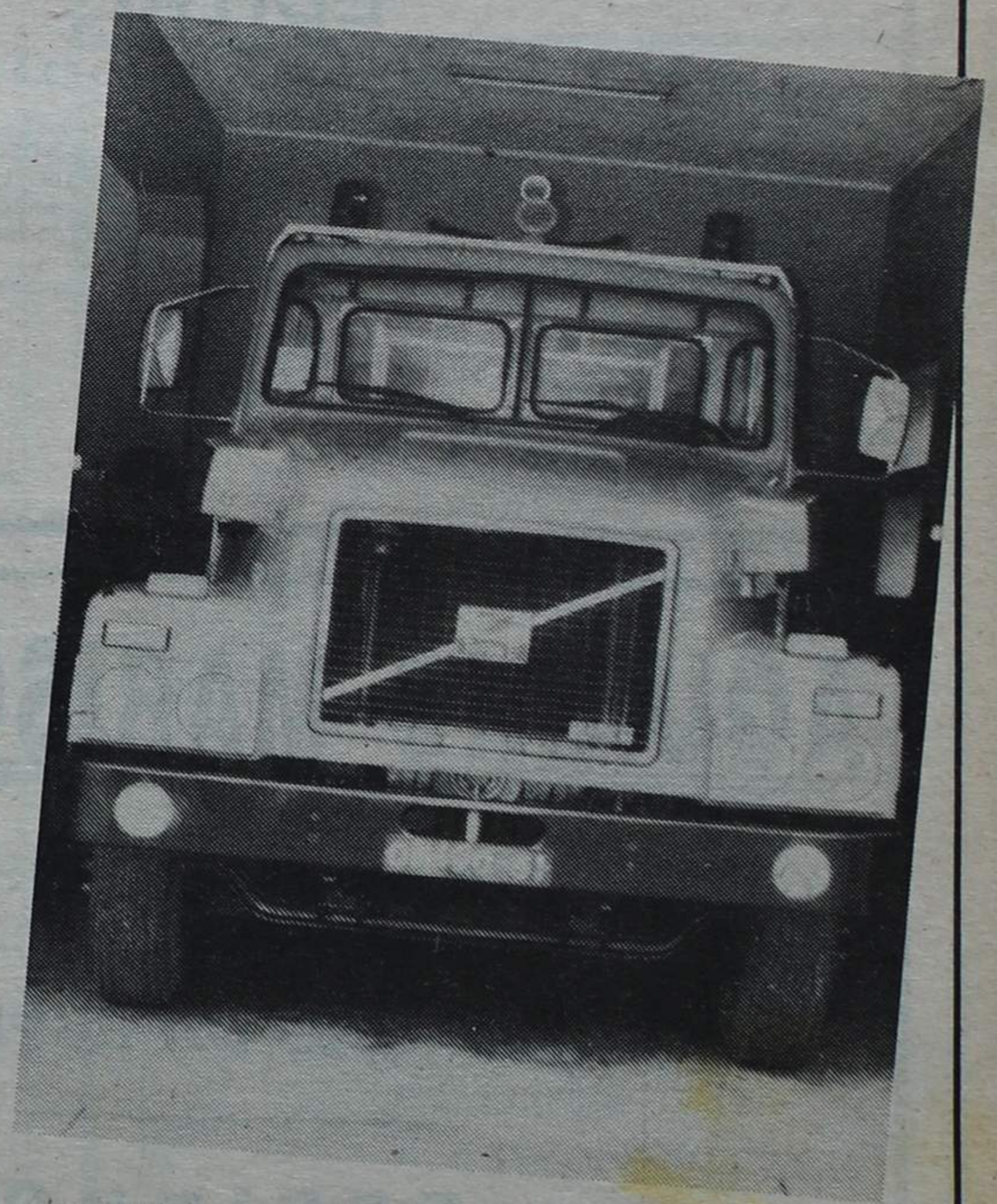
O autotanque que foi inaugurado e que está sobretudo vocacionado para grandes incêndios e para abastecimento domiciliário de água, em casos de falta do precioso líquido