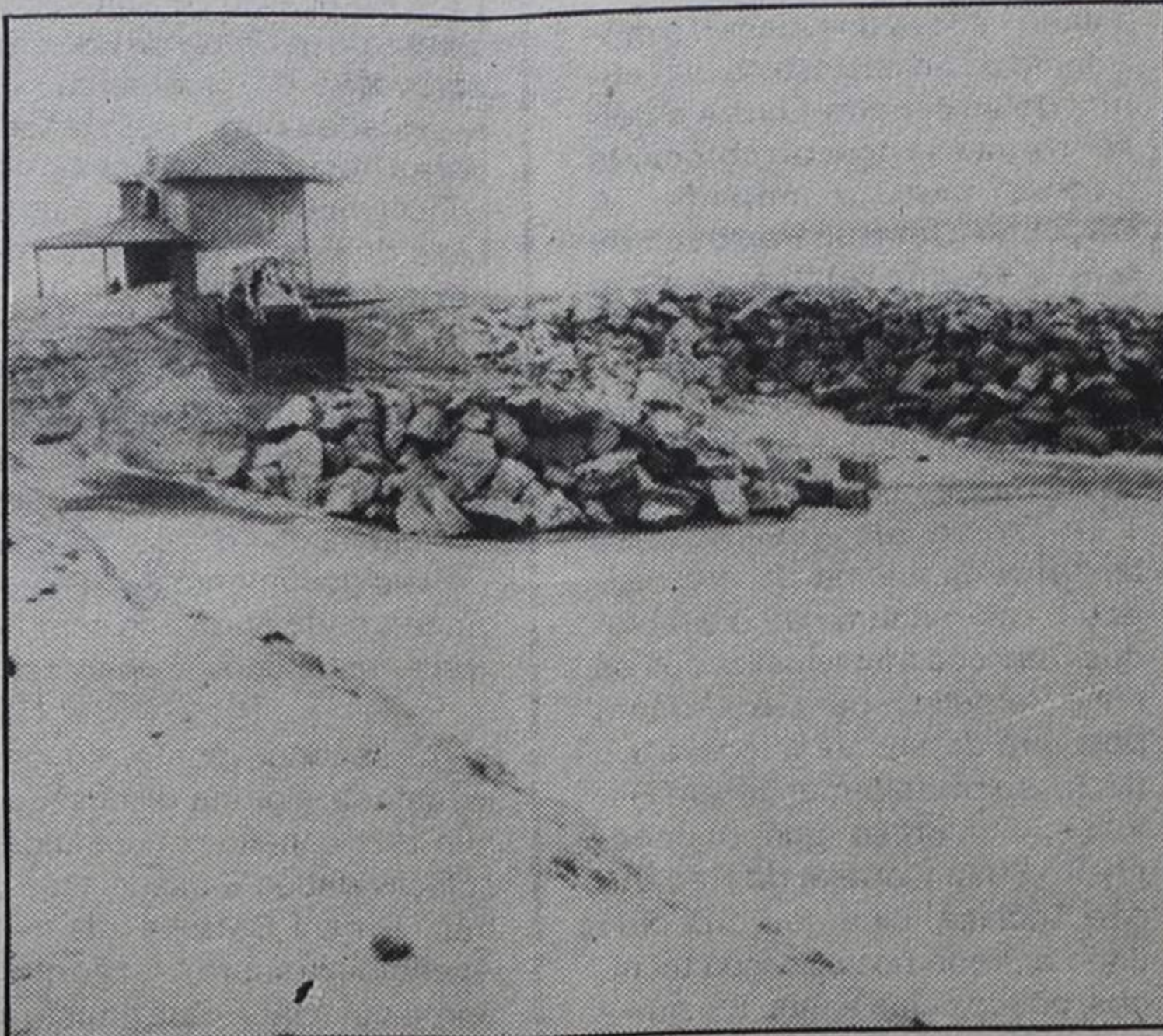
O mar continua a investir forte em Paramos. Até que surja o quinto esporão

A «coisa» é, obviamente, esse mar que não tem «escrúpulos» em derrubar o que se atravessa à sua frente. A construção do esporão está prometida pela Direcção-Geral dos Portos, para o ano que, dentro em breve, vai entrar. Mas o condicionamento é o dinheiro. Se dinheiro houver... Senão, em 1985, voltaremos a ter rostos cansados, quase tão furiosos quanto o mar, a bater-nos à