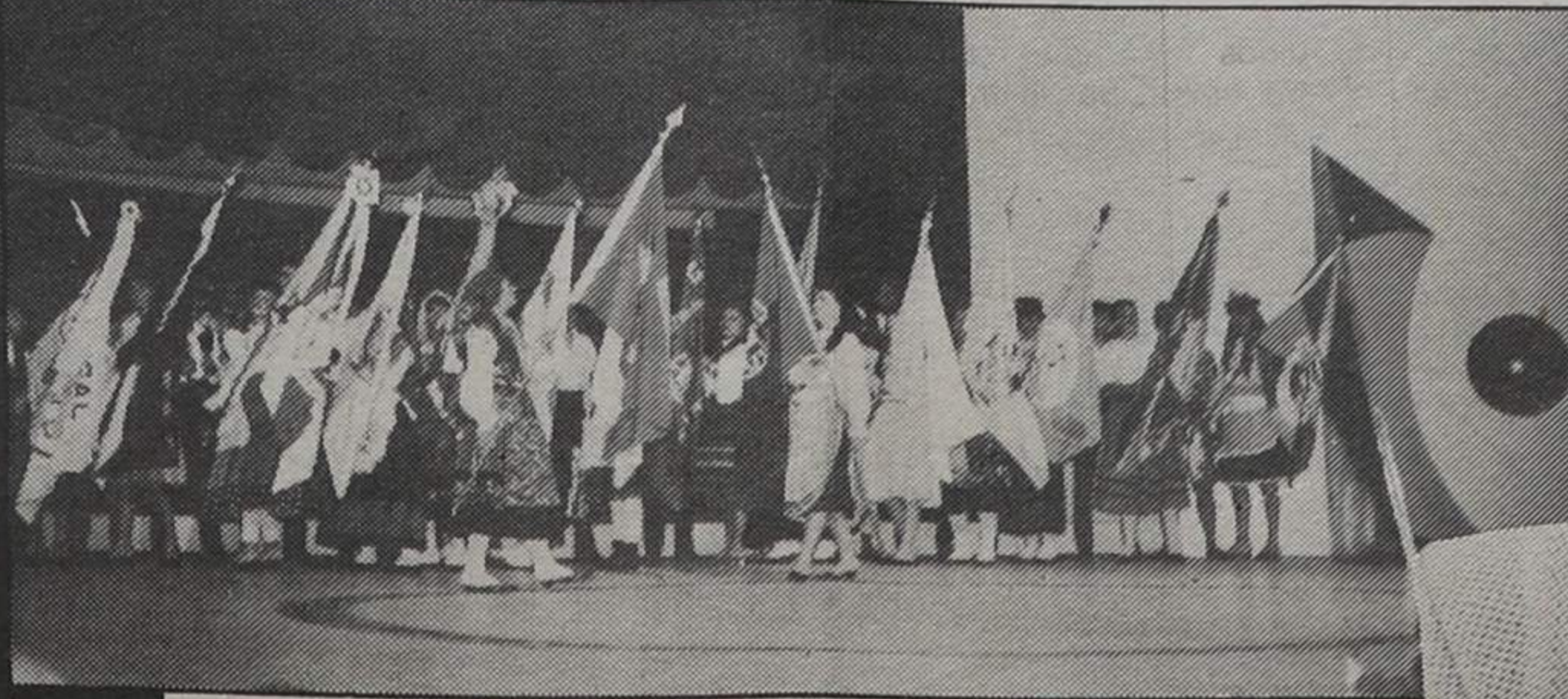
Rancho Folclórico Português do Rio de Janeiro