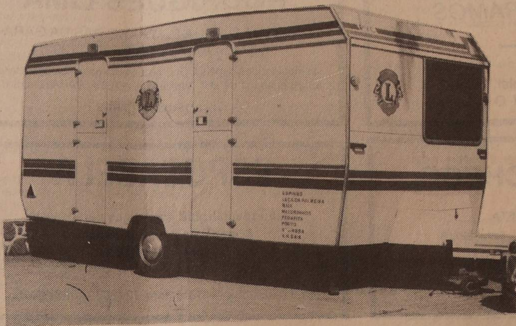
Esta é a «roulotte» onde se efectuaram as duas fases do rastreio visual, promovido pelo «Lions Clube de Espinho»