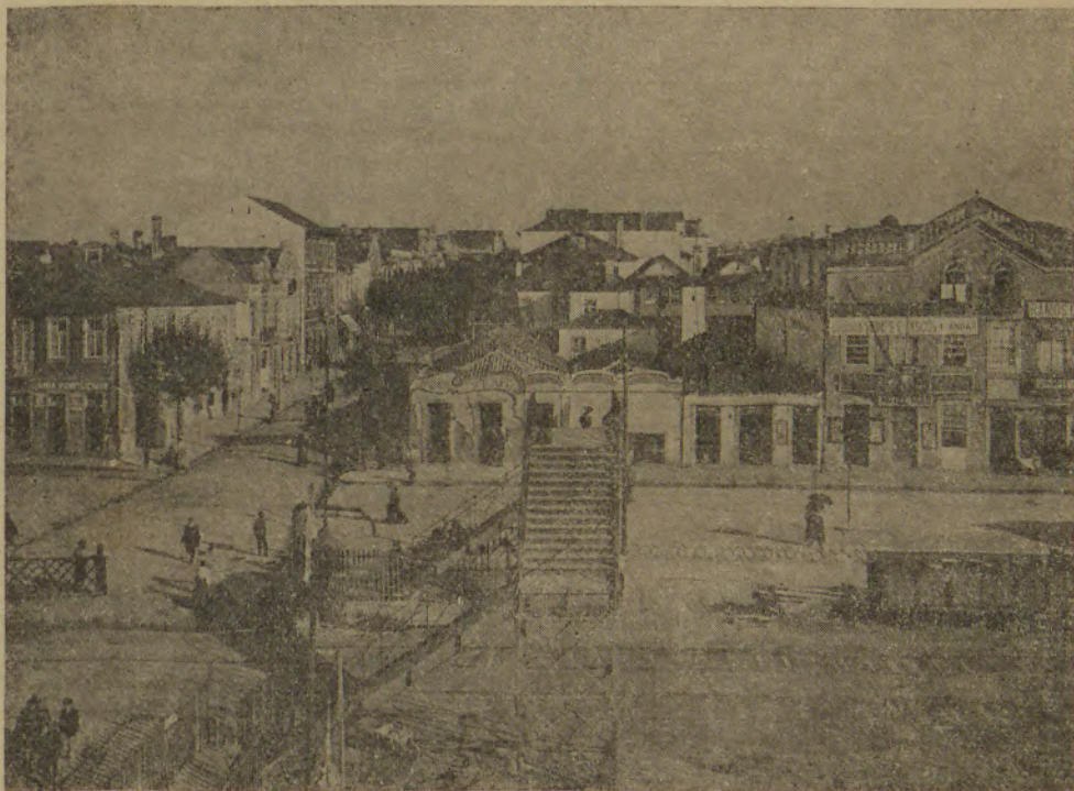
Em 1910 a vista do Hotel Bragança, onde hoje está o Aparthotel, era assim.