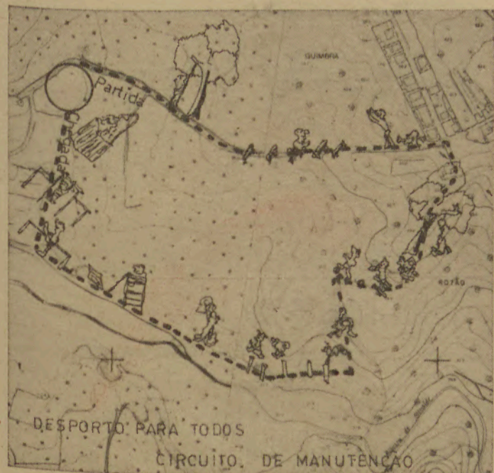
Circuito de Manutenção em Sales já está a ser feito (pág. 5).