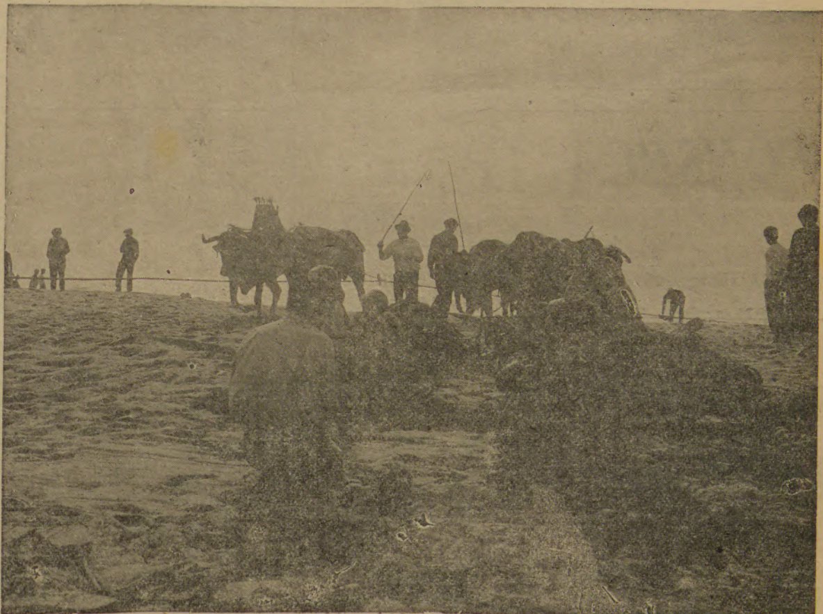
A secular pesca de xávega da nossa terra vai, mais uma vez, ser feita com tractores a puxar as redes, em vez dos bois. A dificuldade em conseguir o gado a preço razoável e o divórcio das entidades locais cada vez mais divorciadas do turismo estão na origem desta mudança.

Este não é, de facto o presidente da Câmara que os espinhenses elegeram em Dezembro de 1981. É um presidente hoje contestado por parte considerável do eleitorado, pela maioria esmagadora militantes do partido que o elegeu e pela totalidade da oposição partidária. Pese embora uns apoios inertes, admissíveis por interesses estratégicos de curto prazo,