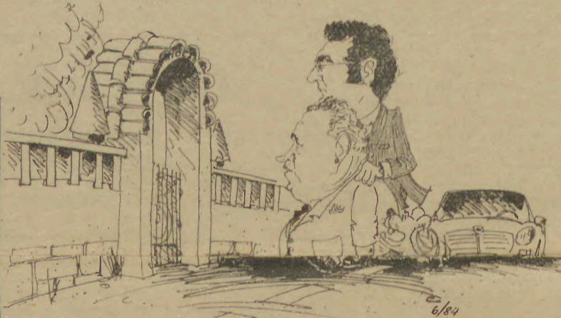
— No que a gente se meteu! — bufa o Odorico.

Enfim, tudo pode acontecer num país onde os corruptos profissionais e oportunistas abundam.