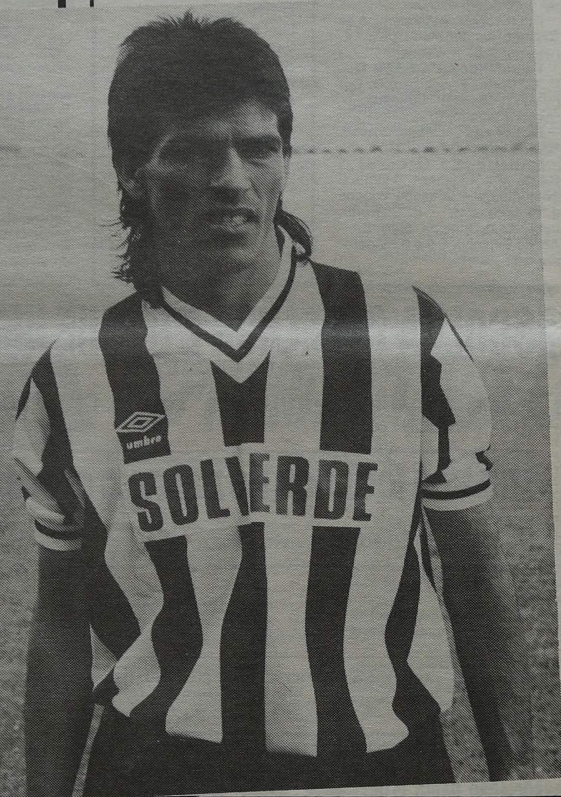
Ado — a esperança é de «fazer uma boa época ao serviço dos tigres»