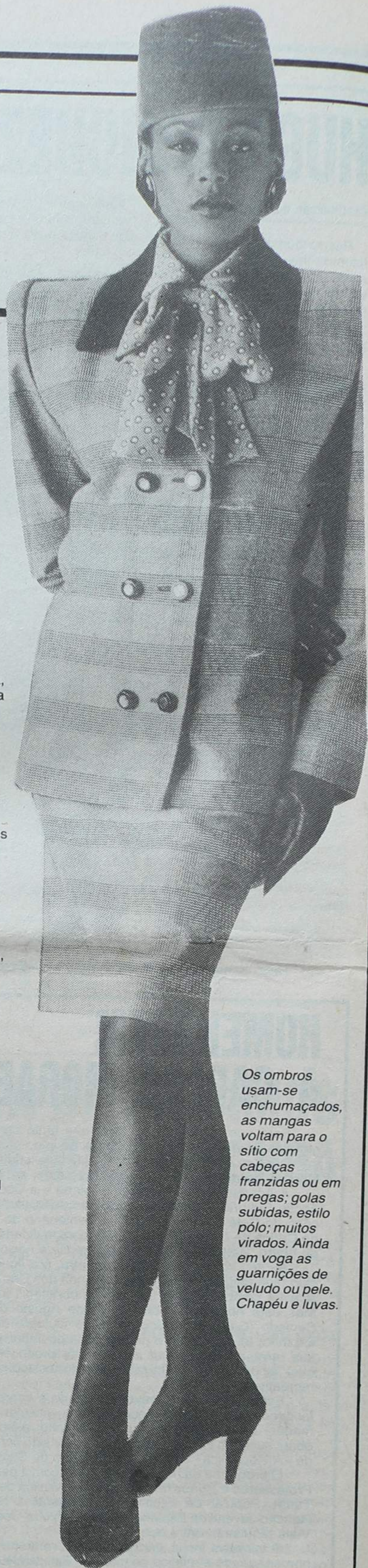
Os ombros usam-se enchumados, as mangas voltam para o sítio com cabeças franzidas ou em pregas; golas subidas, estilo pólo; muitos virados. Ainda em voga as guarnições de veludo ou pele. Chapéu e luvas.

Quanto à Espanha podemos dizer que está perfeitamente à altura de « competir com a França. Primeiro porque tem muito bons costureiros, nomeadamente os da nova geração. Segundo porque os couros de Barcelona e Palma de Maiorca são «reis ». Bom, mas vamos aguardar mais uns dias para ver a coleção Outono/Inverno. Trará, certamente, surpresas agradáveis para quem gosta e pode, andar bem. Pelo menos já sabemos que elegância não faltará e que a época está a favor da feminilidade.