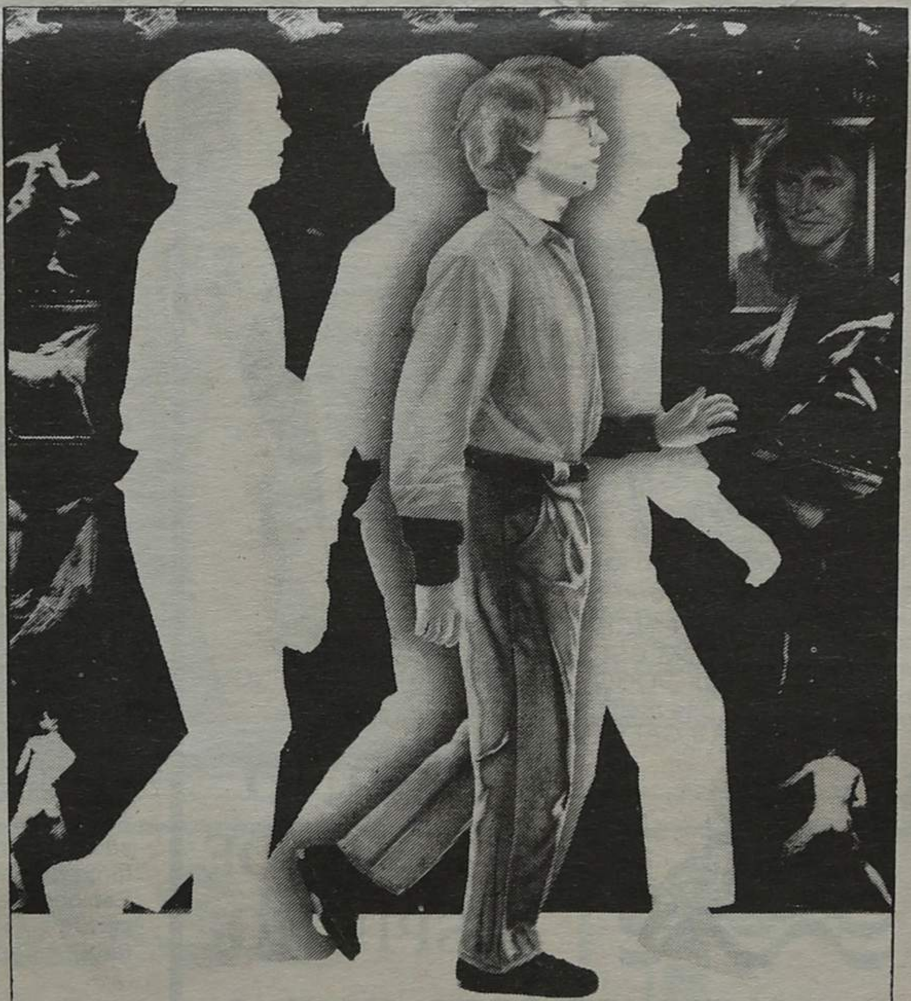
Filme canadiano — este e mais 14 representam aquele país. É, no entanto, a Checoslováquia que mais filmes apresenta no Cinanima/87

«É necessário — acrescenta a organização — ir mais longe e cuidar dos aspectos pedagógicos e de formação».