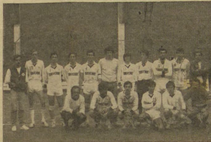
A actual equipa sénior do Sp. de Espinho.

A equipa sénior do Sp. de Espinho, reconquistou, passados 20 anos, o título de Campeão Nacional de Voleibol.