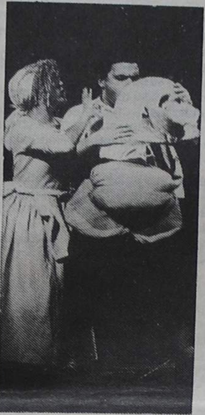
Uma cena da peça de António José de Almeida

que sejam homenageados conforme sua linhagem e feitos, será oferecido um banquete em suas honras ordenando-se a todos que os recebamos condignamente.