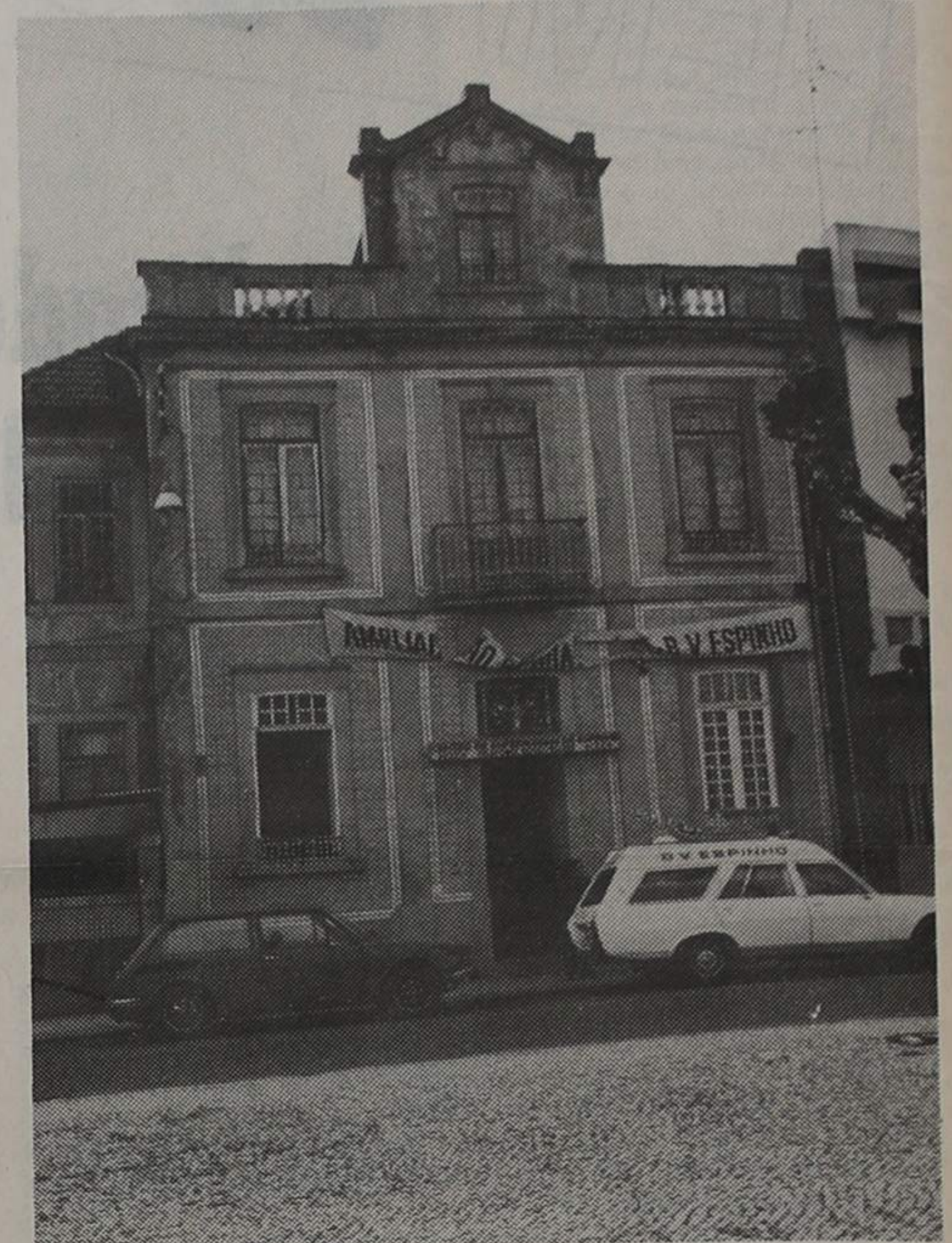
Um dia a casa vai abaixo... Centro de Enfermagem será sacrificado para se ampliar o quartel dos BV Espinho

pessoa que se encontra já em perigo de afogamento e a quem é necessário prestar os primeiros socorros (respiração artificial e massagem cardíaca), já fora da água e antes de a conduzir ao hospital. Isso acon-