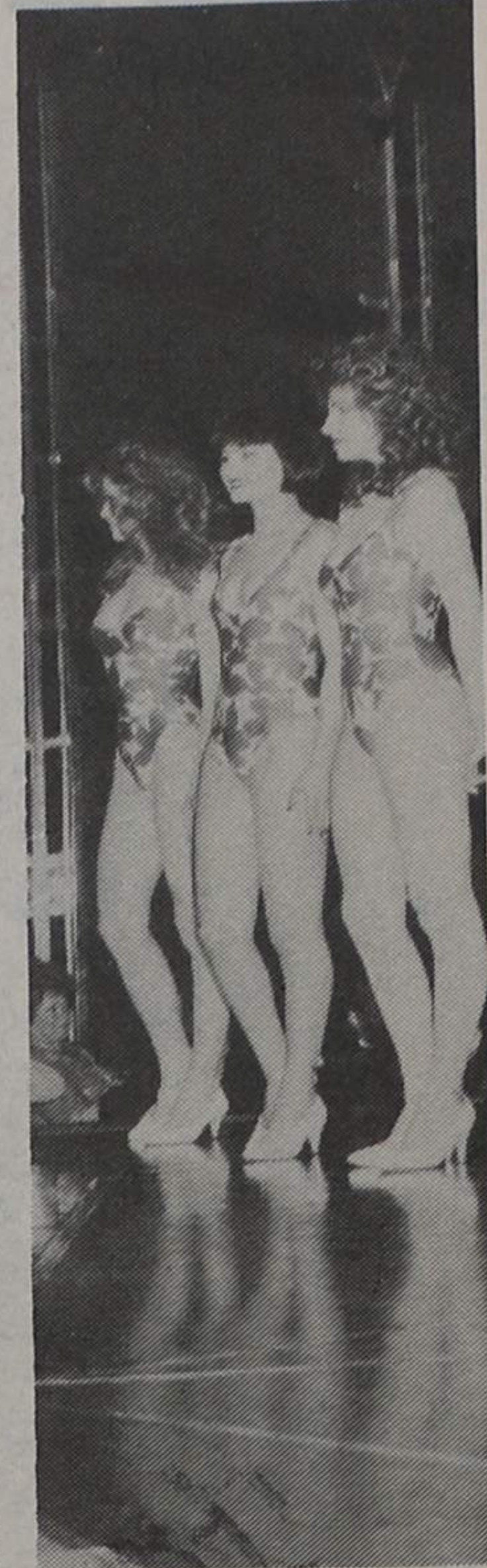
Três exibem as curvas