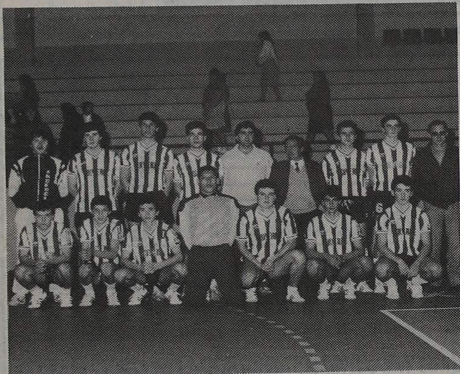
Turma juvenil do Sporting de Espinho, campeã regional sem derrotas