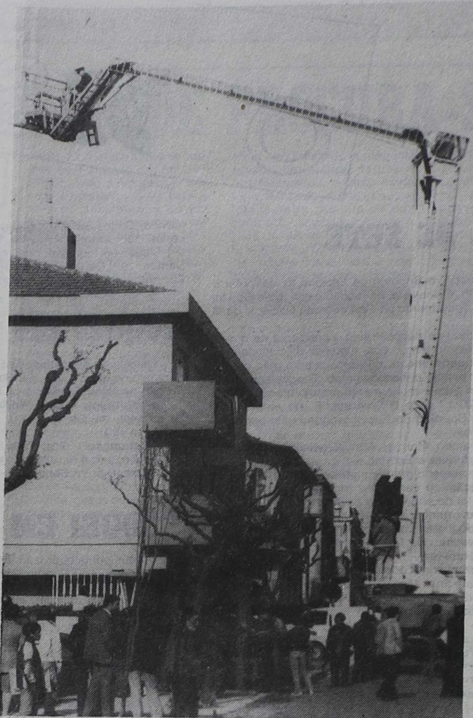
Viatura auto-escada de 32 metros, uma vez experimentada pelos BV Espinho, como se pode ver na foto. A aquisição desta auto-escada é um desejo da corporação mas por ora é um mero sonho