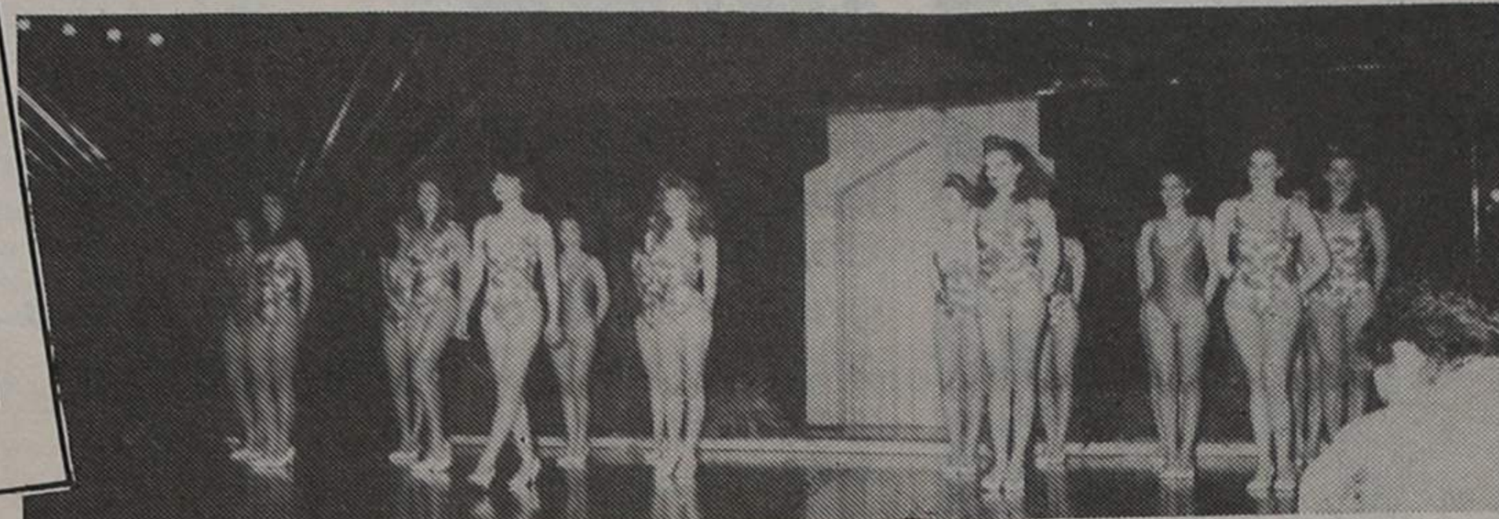
...E em fato de banho

Como anunciáramos, as candidatas ao título Miss Portugal/88 estiveram em Espinho, mais precisamente no Casino. E como nisto de misses, a melhor forma de contar é mostrar, eis a reportagem fotográfica de Manuel Granja