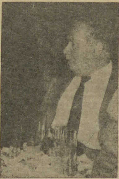
O presidente da Câmara

4. A CME irá desenvolver diligências no sentido de procurar viabilizar o expresso no ponto 3, desta acta, e, com a brevidade possível, informar a CP do seguimento do assunto.