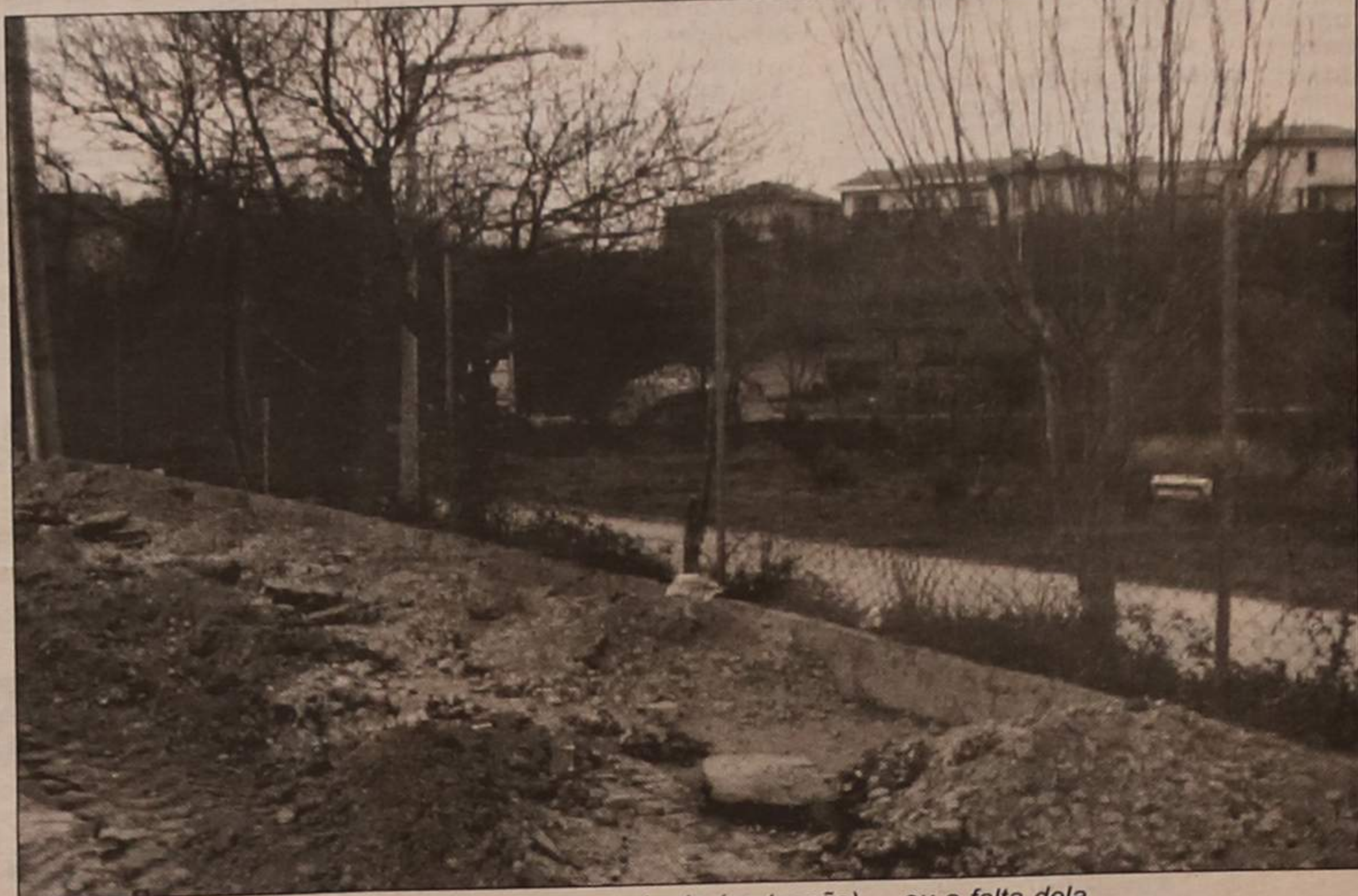
Parque de campismo: a rede de (protecção) ... ou a falta dela

A Câmara Municipal de Espinho ratifica o texto do Aviso de rectificação e declara-o conforme com o aludido Programa de Concurso e considera o mesmo Aviso como acto de execução efectuado pelo senhor presidente da Câmara;