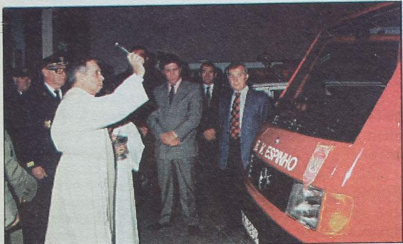
A bênção à nova viatura

Já no próximo mês de Janeiro, chegará a Espinho uma auto-escada que a corporação adquiriu na Inglaterra. Trata-se de uma das melhores viaturas do género no nosso país.