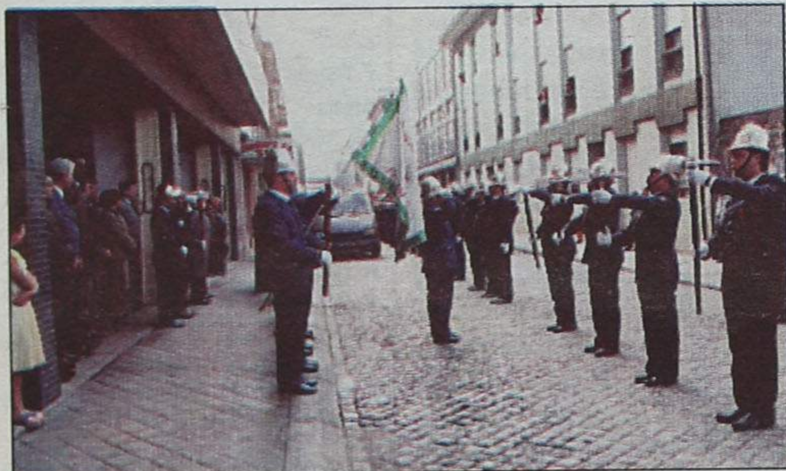
O cumprimento aos "Espinhenses"

A mostra terá a duração prevista de um mês e poderá ser visitada durante todo o dia.