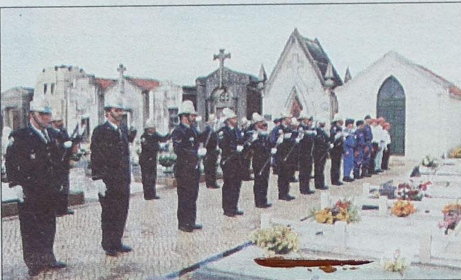
A homenagem aos bombeiros e associados falecidos