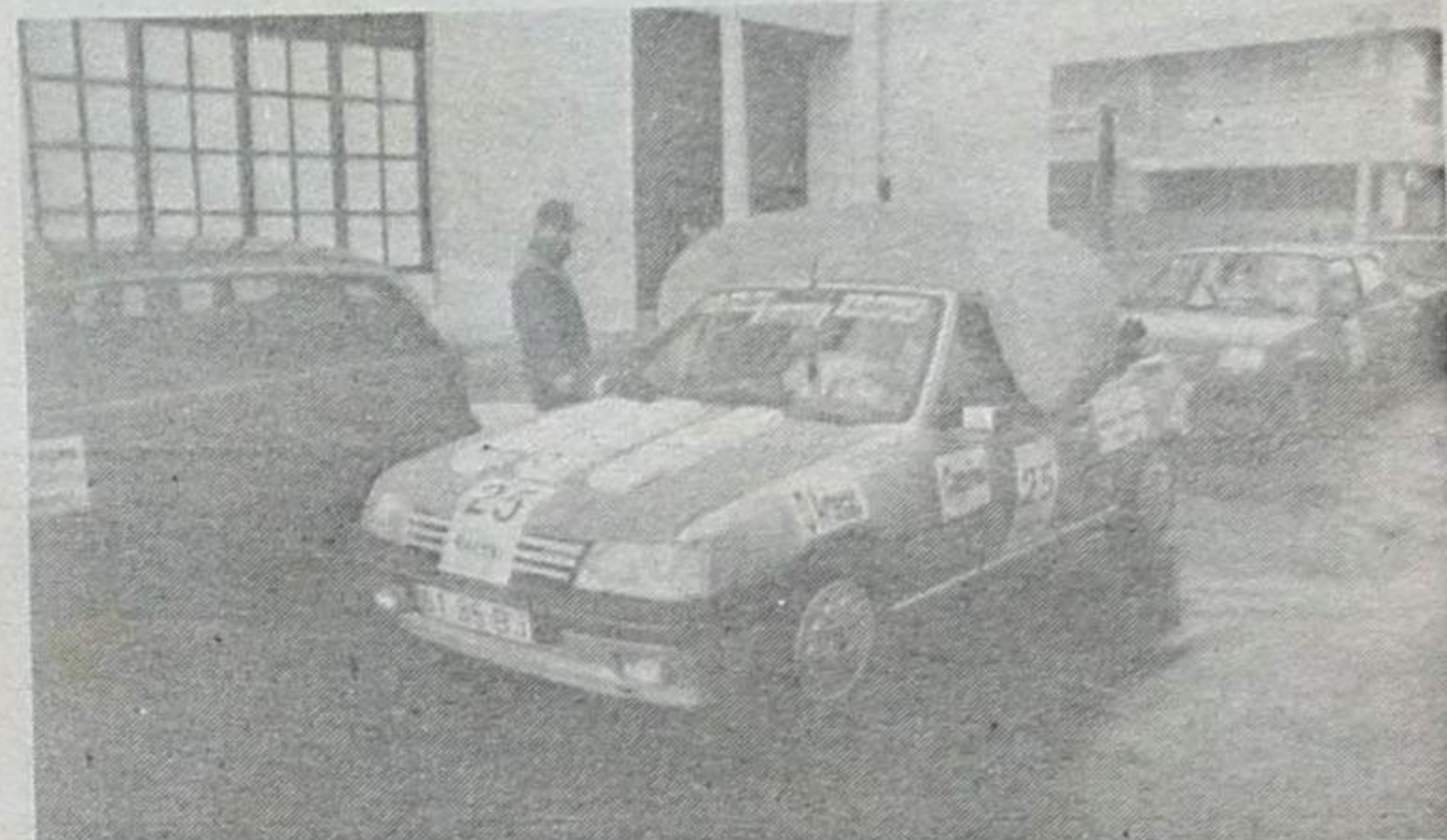
O carro mais bem decorado

A partida, como habitualmente, foi dada junto ao Casino Solverde. Depois, os concorrentes seguiram para Paramos, onde tiveram de