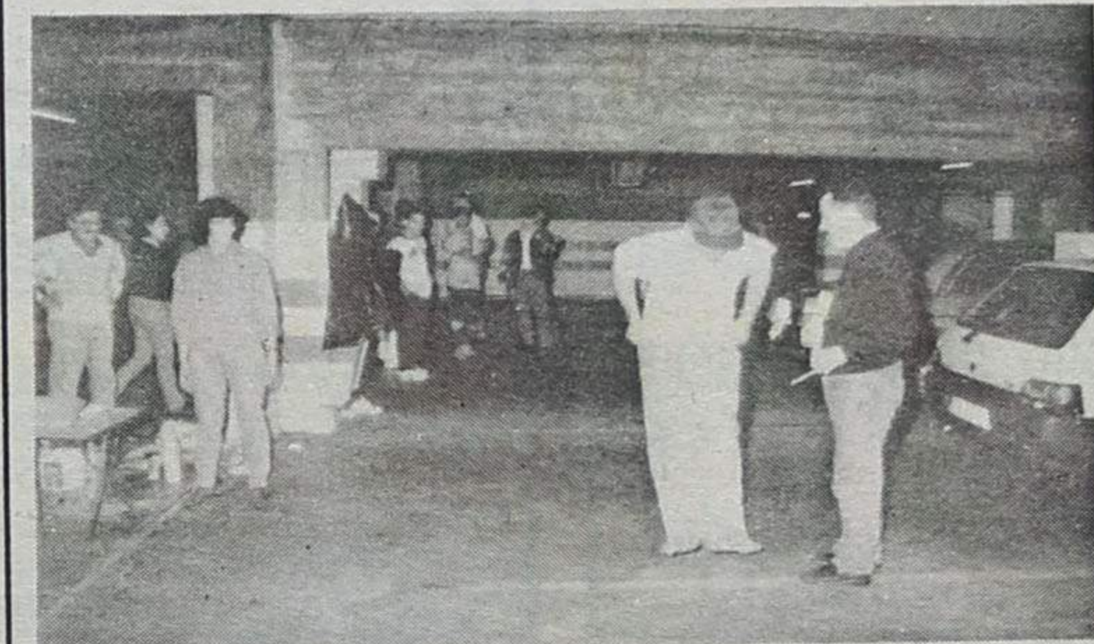
Uma animada "corrida" de sacos, a encerrar a prova

andar a contar postes de iluminação. Já em Esmoriz, houve quem tivesse de saltar a vedação da ETAR para po-