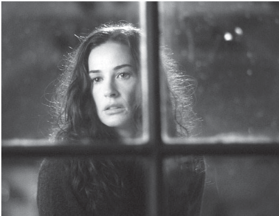
"Half Light", filme de Craig Rosenberg protagonizado por Demi Moore, abre o FEST — Festival Internacional de Cinema Jovem de Espinho na primeira Gala Antestreia do certame

É já a partir de dia 9 que Espinho acolhe o melhor que se faz no cinema jovem pelo mundo fora na terceira edição do FEST — Festival de Cinema e Vídeo Jovem: 27 países em competição, 123 produções a concurso, 25 das quais portuguesas, 9 filmes em antestreia, 2 retrospectivas e 1 maratona de cinema 'Curto Circuito' são alguns dos números de oito dias de muito e bom cinema.