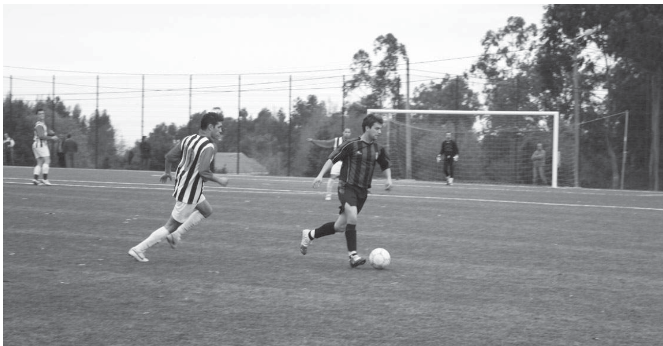
O jogo entre o Juventude dos Outeiros e o Lomba de Paramos foi emocionante