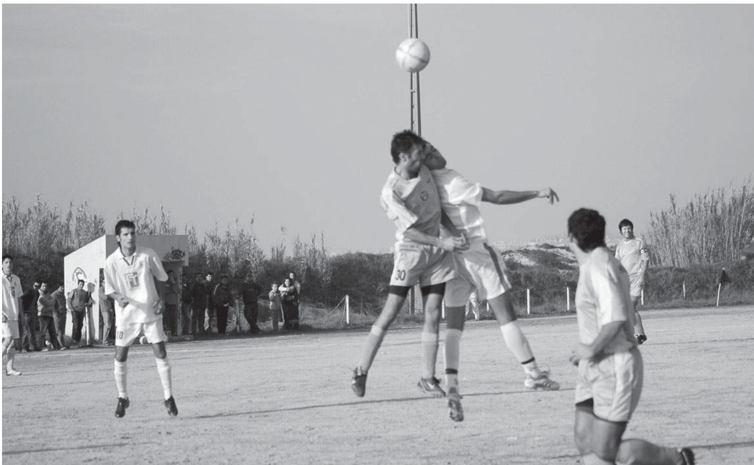
Bairro da Ponte de Anta e Grupo Desportivo da Idanha defrontaram-se no campo do Rio Largo