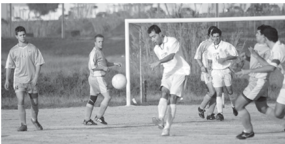
Não há mão na bola; (depois) aparenta ser falta e (sem dúvida) há estilo (no remate)!