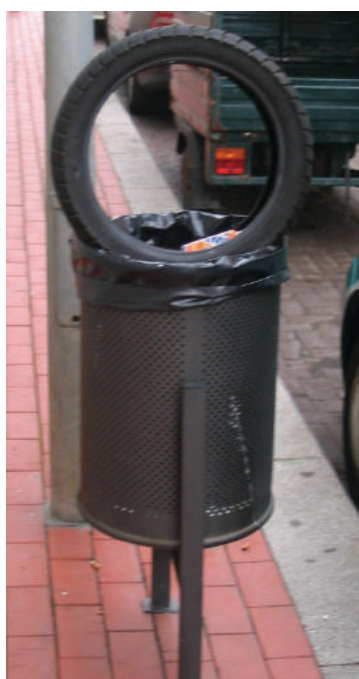
Imagem recolhida na Rua 16 – será que não sabem o que é um ecoponto?

Será normal a localização deste contentor em frente a uma escola (n.º 2 de Espinho) e no meio da estrada? Se acontecer um acidente nesta zona da Rua 22 de quem será a culpa?