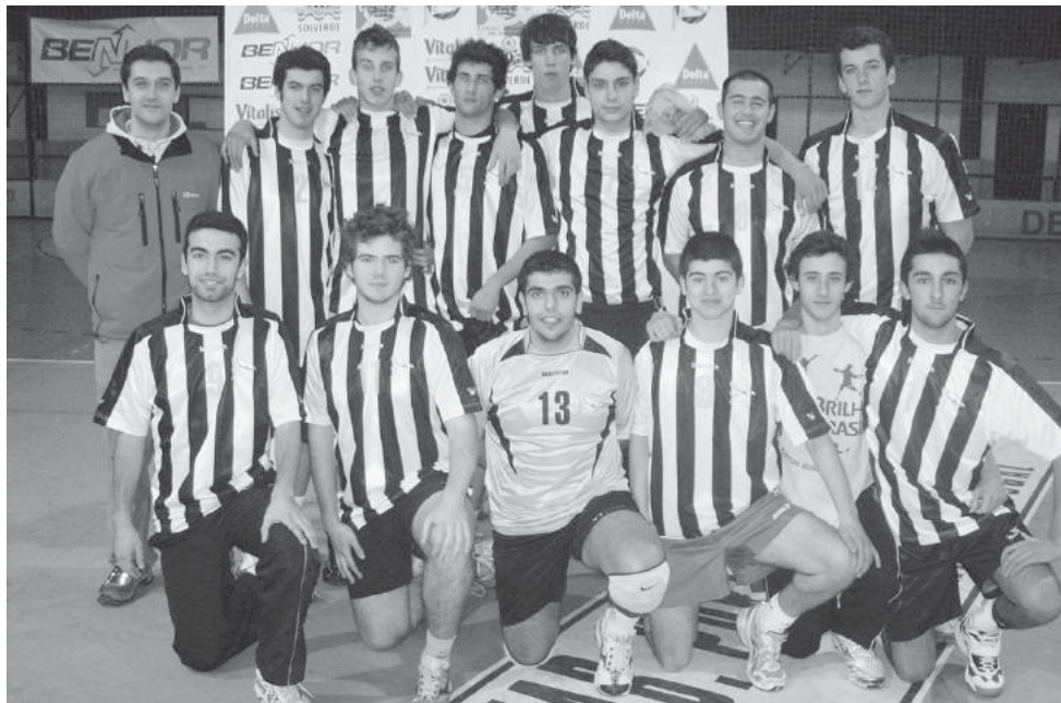
Os juniores (à esquerda) e os iniciados (à direita) do Sporting de Espinho apenas perderam dois encontros nos vinte jogos disputados