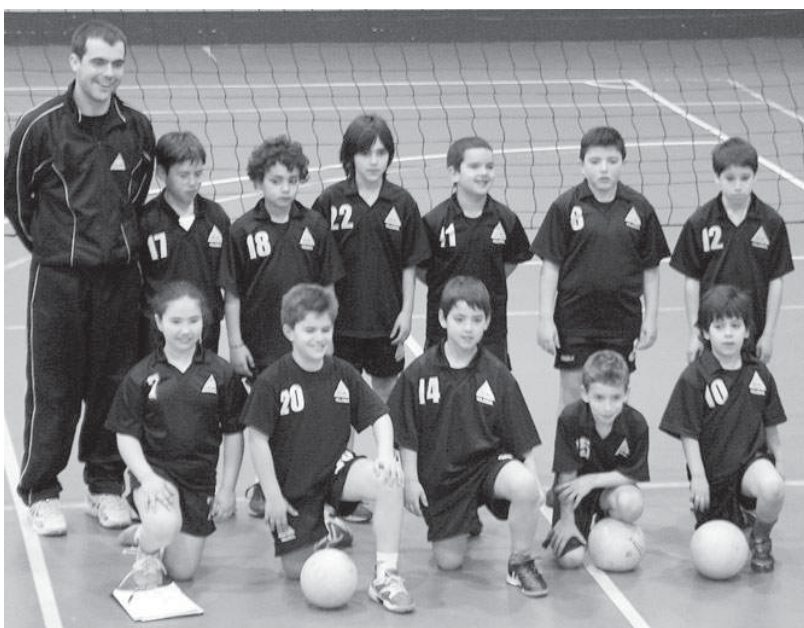
A equipa de minis da Associação Académica de Espinho conquistou o terceiro lugar no Torneio de Carnaval

As equipas masculinas de voleibol de iniciados e de juniores do Sporting Clube de Espinho, sagraram-se, este fim-de-semana, vice-campeões regionais da Associação de Voleibol do Porto. A equipa de juniores masculina, orientada por Bruno Fonseca, apenas claudicou perante o