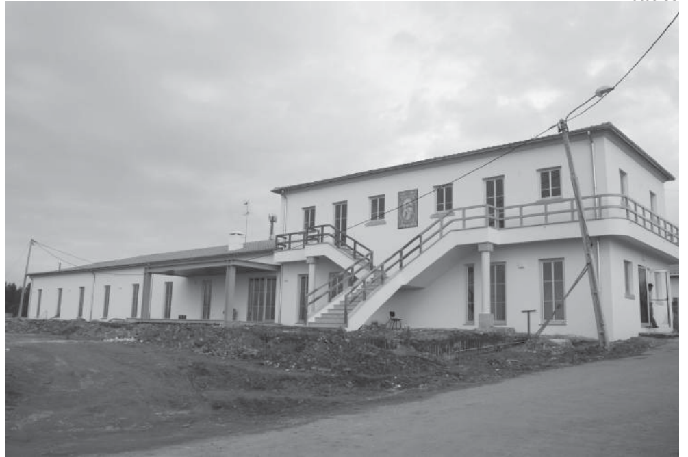
A pessoas que se encontravam na antiga casa de acolhimento temporário do projecto "Novo Rumo" serão agora transferidas para as novas instalações (foto superior) com capacidade para dez utentes

um curso remunerado que lhe irá dar equivalência ao nono ano e mesmo depois do azar lhe bater à porta (caiu à cerca de uma semana e partiu uma perna) não desanima, e garante sentir-se realizado pois "em breve terei condições para reencontrar a minha vida".