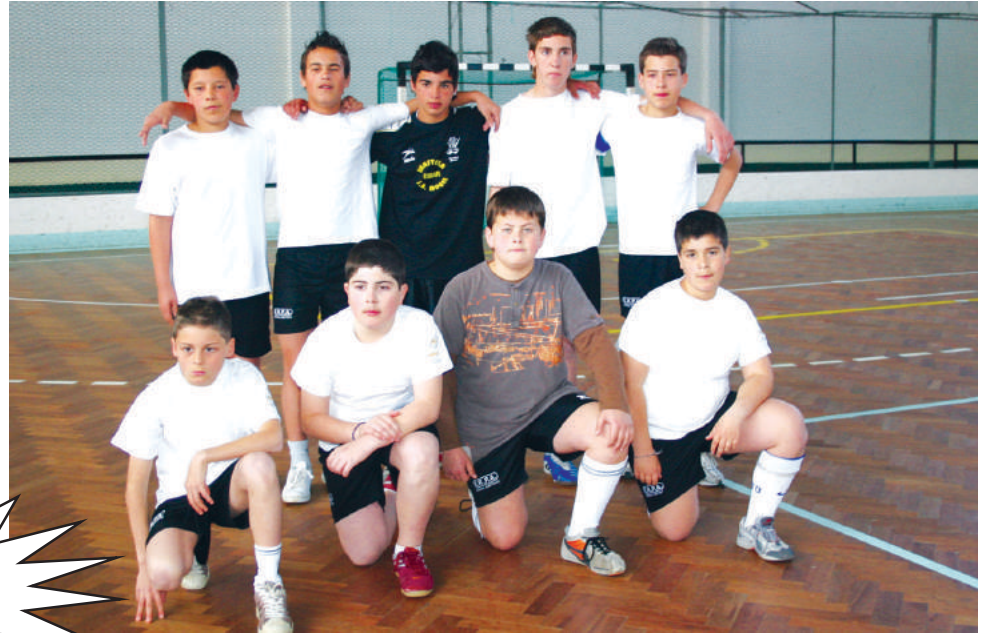
Centro Comunitário 'Espaço Vivo'