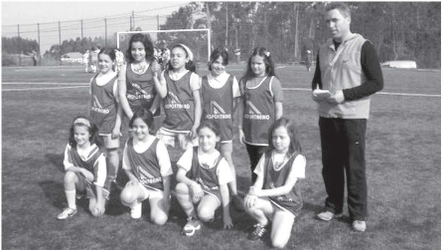
EB do Calvário – equipa feminina