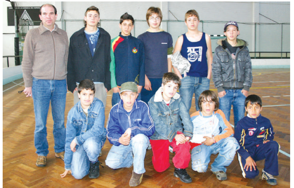
Centro Comunitário da Ponte de Anta

Torneio de futebol inter-instituições com final festiva no pavilhão da Académica de Espinho