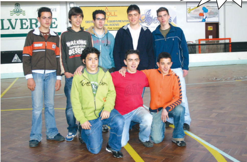
Centro Comunitário de Esmoriz