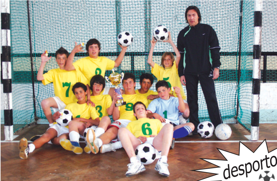
Centro Comunitário 'Espinho Mar, Espinho Terra'