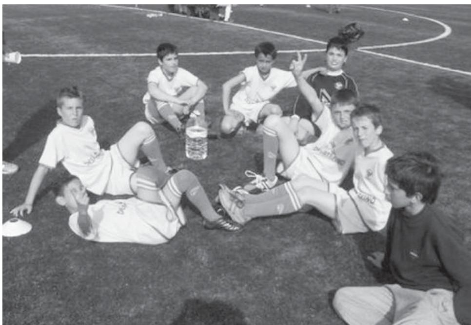
Equipa da Marinha 2

EB1 Calvário-Esc. Silvalde FC..... 1-3 EB1 Quinta da Seara-EB1 Marinha 1 ..... 3-1 Esc. Silvalde FC-EB1 Marinha 1 ..... 8-0