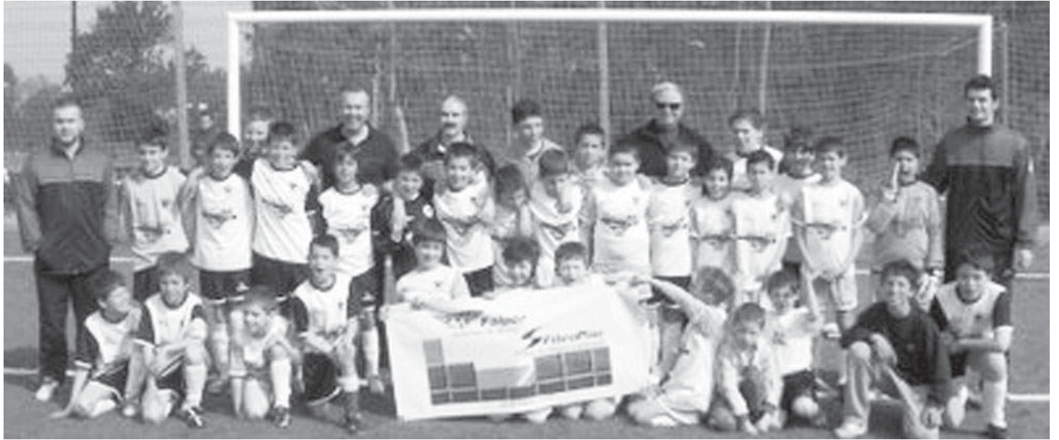
Escolinhas de Futebol de Silvalde