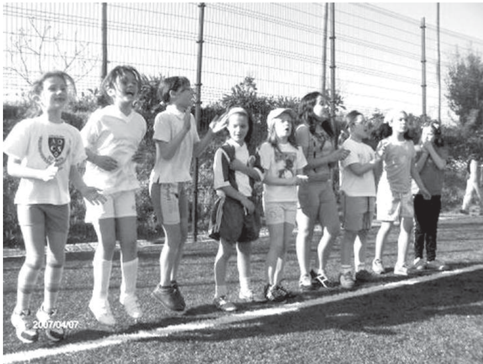
EB do Calvário – equipa feminina e claque