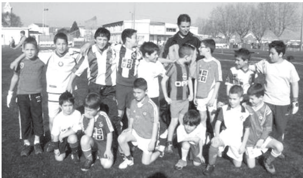
EB da Marinha 1