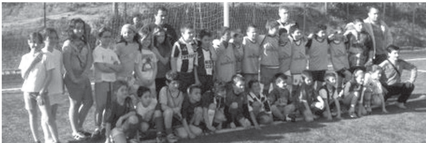
EB do Calvário