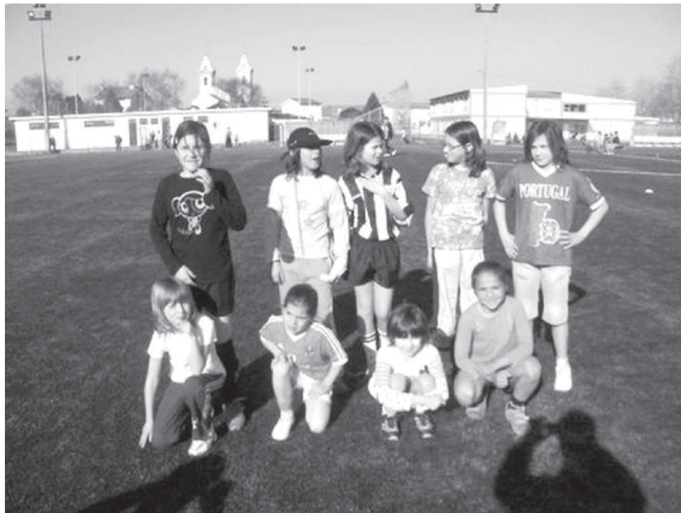
EB da Marinha 1 – equipa feminina