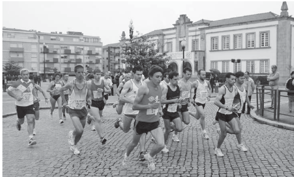
A tradicional corrida da liberdade no concelho