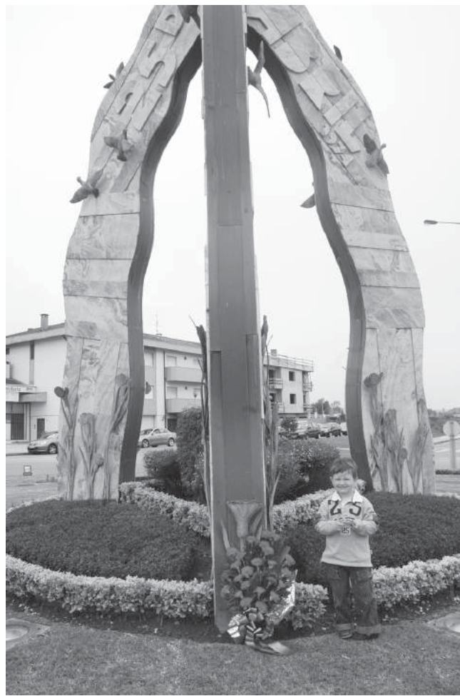
O PCP prestou a tradicional homenagem ao 25 de Abril com honras no monumento da rotunda da Rua 33 com a Avenida 32