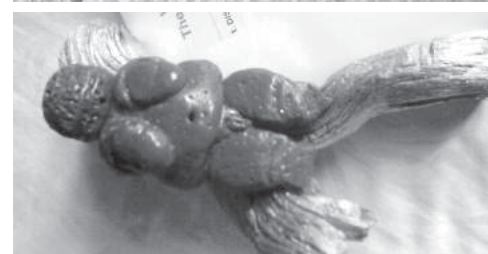
A "Vénus de Willendorf"