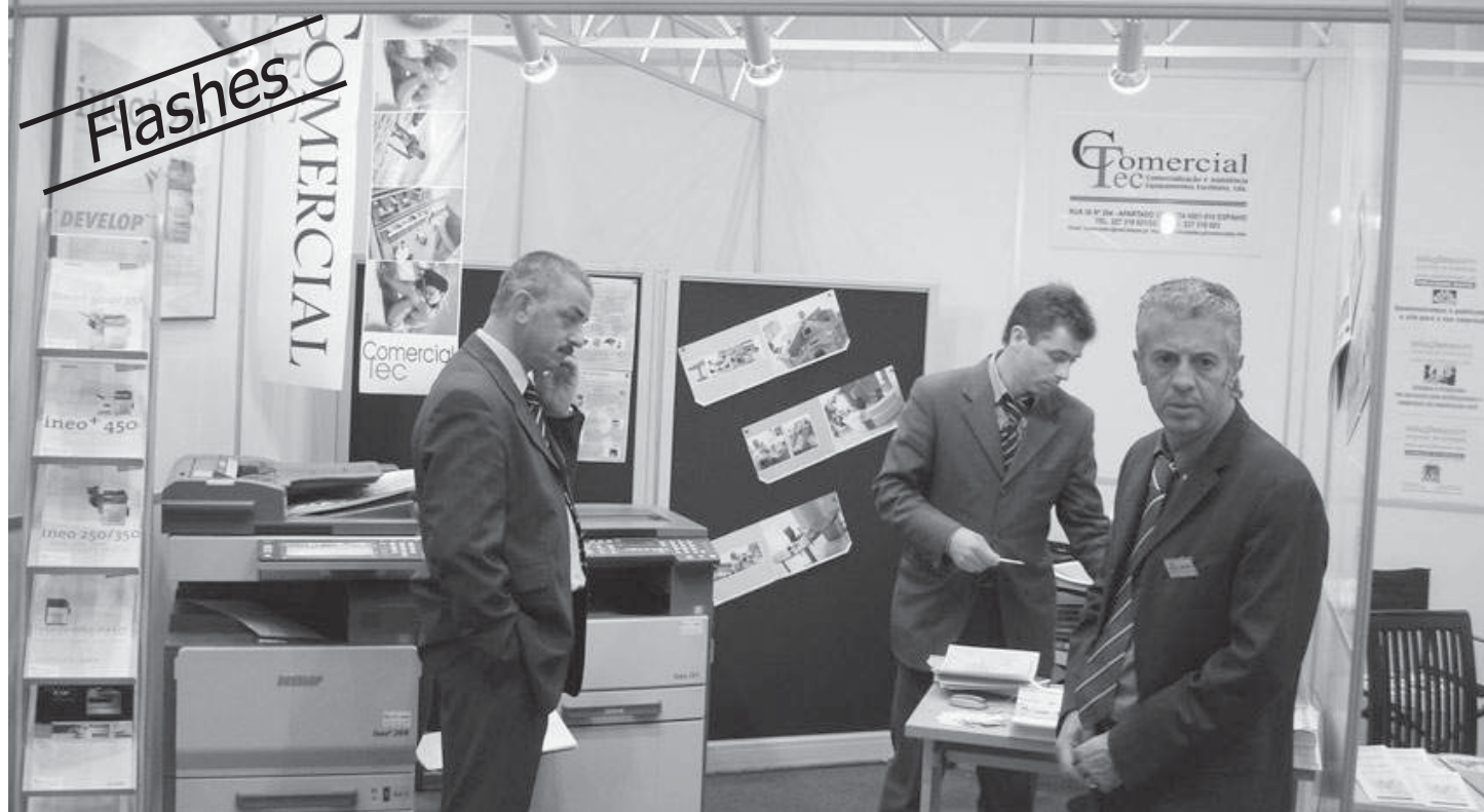
A empresa espinhense, ComercialTec esteve presente na Feira de Negócios que decorreu, recentemente, em Santa Maria da Feira

Na correspondência dirigida à secção do "Correio do leitor" – por carta, fax, ou e-mail – os interessados devem identificar-se com o nome, o endereço, o contacto telefónico e o número do Bilhete de Identidade, mantendo-se, todavia, apenas no rodapé dos textos publicados o nome e a localidade dos autores.