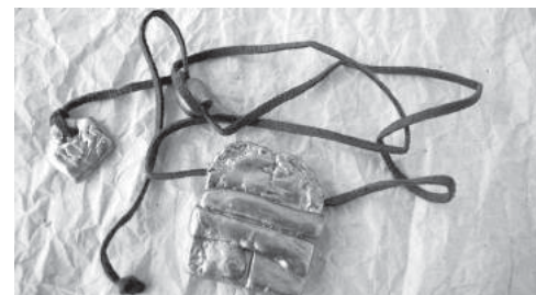
"O Beijo" de Constantin Bransu

Note-se que sendo peças, na sua maioria, nascidas da imaginação da artista é perfeitamente possível efectuar alterações ou fazer uma peça com determinadas características definidas pelo cliente.