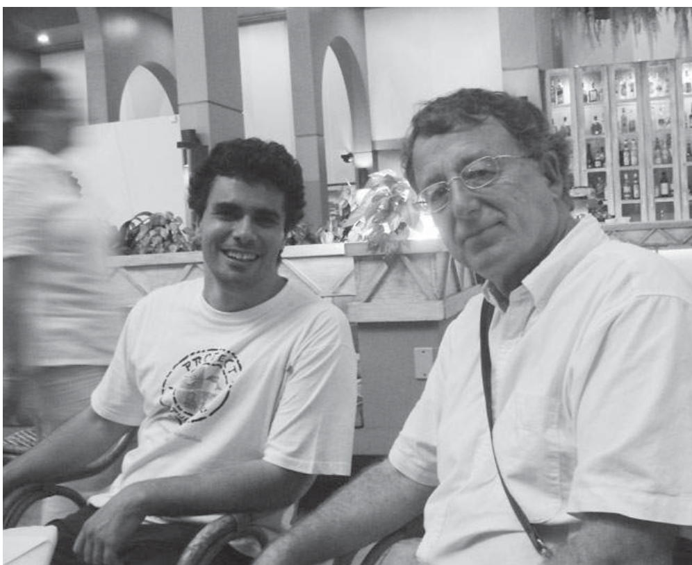
O Professor Catedrático espinhense com Dennis Sullivan

desenvolver o meu trabalho de Pós-Doutoramento com ele.