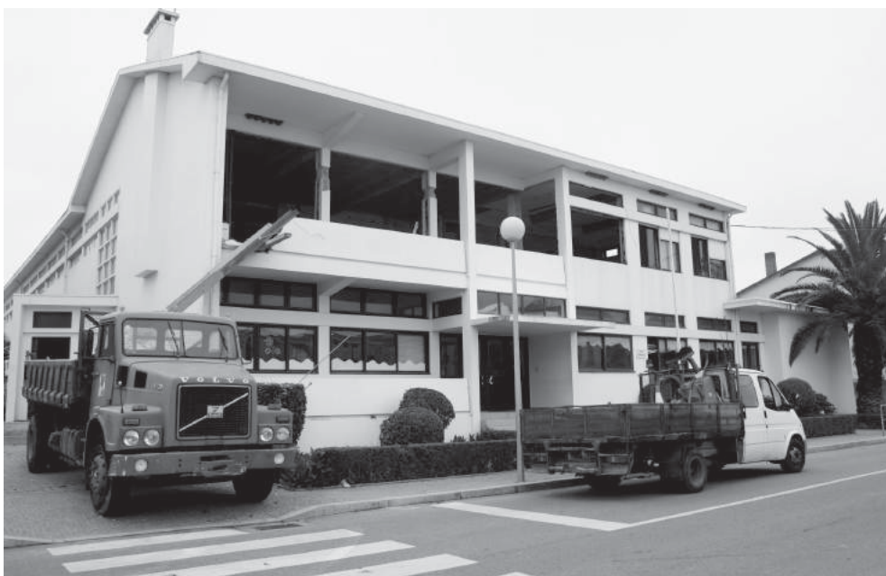
As obras na Escola n.º 3 de Espinho já são visíveis, estando a ser preparado o piso que já albergou a Biblioteca Municipal e, mais recentemente, a Universidade Sénior, para a instalação de novas salas de aula

Entretanto, já se está a preparar o próximo ano lectivo ao nível da programação da oferta das diversas actividades de enriquecimento curricular e da candidatura ao Programa.