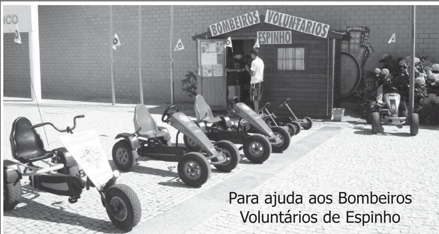
Para ajuda aos Bombeiros Voluntários de Espinho