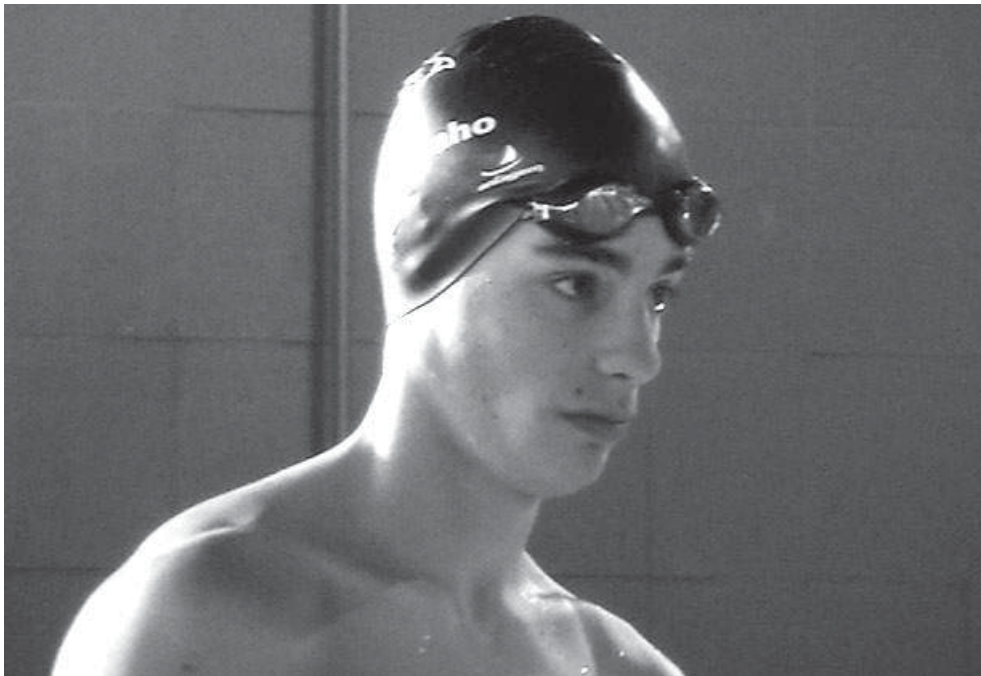
Natação do Sp. Espinho

Com treze tigres (sete masculinos e seis femininos) nos escalões de juvenis, juniores e seniores, realizou-se no sábado, em S. João da Madeira, o Torneio Ano Novo, organizado pela Associação de Natação de Aveiro. Com a particularidade de só contar a classificação colectiva, o Sporting de Espinho alcançou brilhantemente o segundo lugar em dez clubes participantes, melhorando dois lugares em relação ao ano passado.