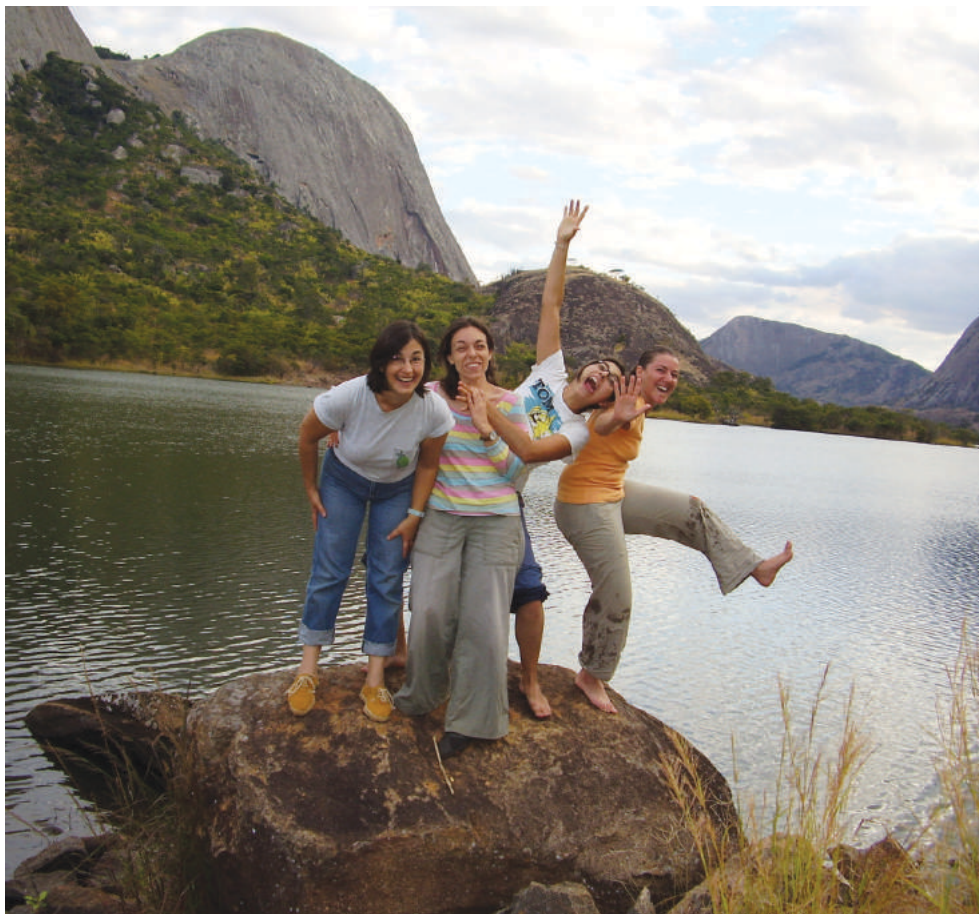
A barragem de Mitucué