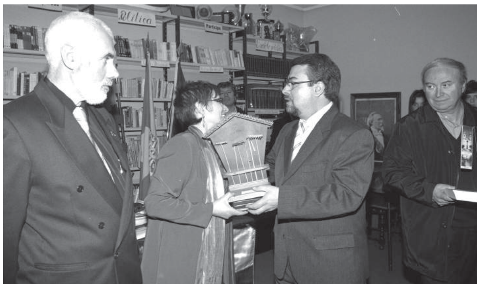
Rancho Folclórico S. Tiago de Silvalde