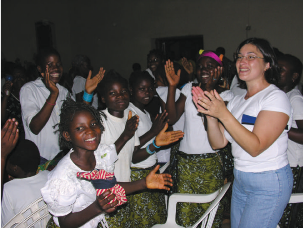
Véspera de Natal em 2006