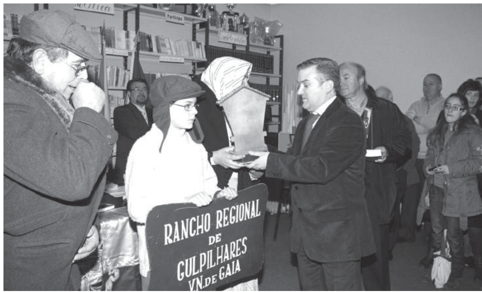
O V Encontro de Cantares de Janeiras decorreu no sábado, sob a organização do Rancho de S. Tiago de Silvalde e com a colaboração da Junta de Freguesia de Silvalde e Câmara Municipal de Espinho.