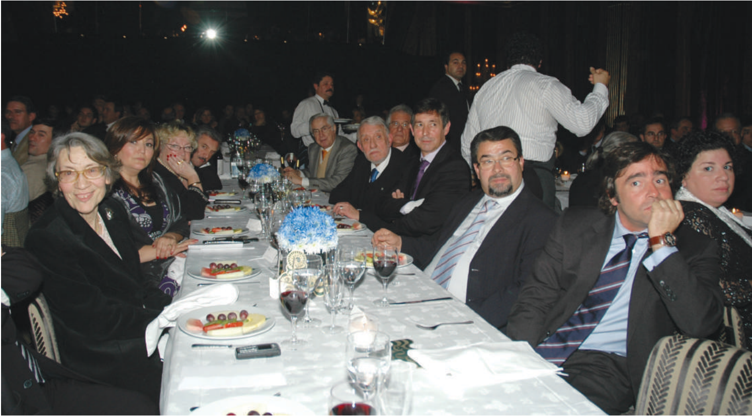
O primeiro prémio da Casa do FC Porto