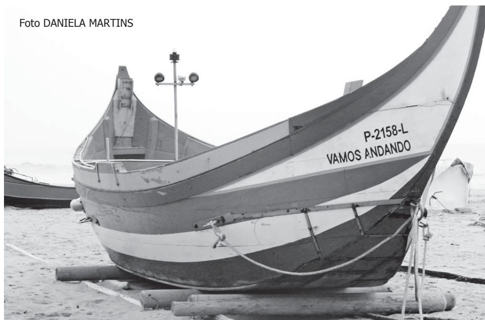
As embarcações (e o material de apoio) da arte xávega em terra no inverno