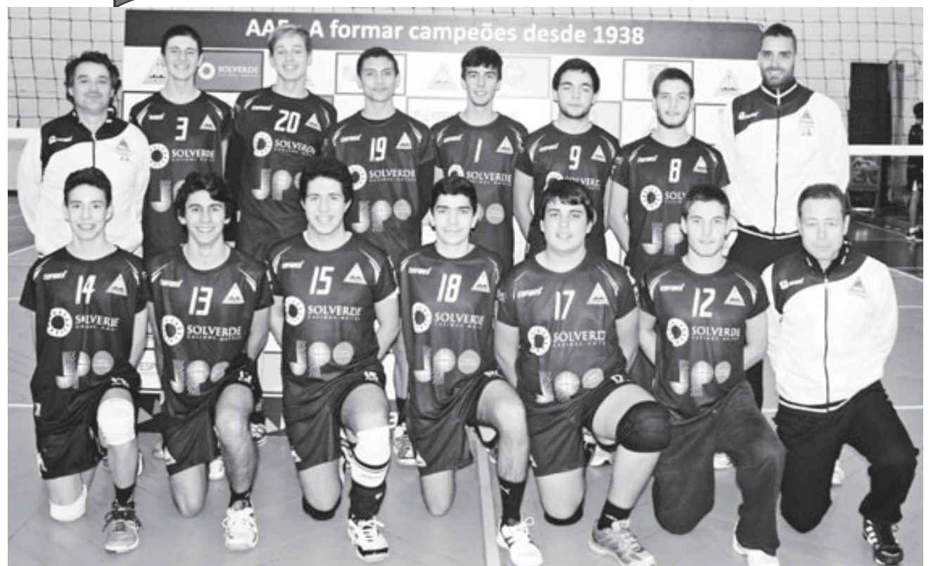
Juvenis da Associação Académica de Espinho