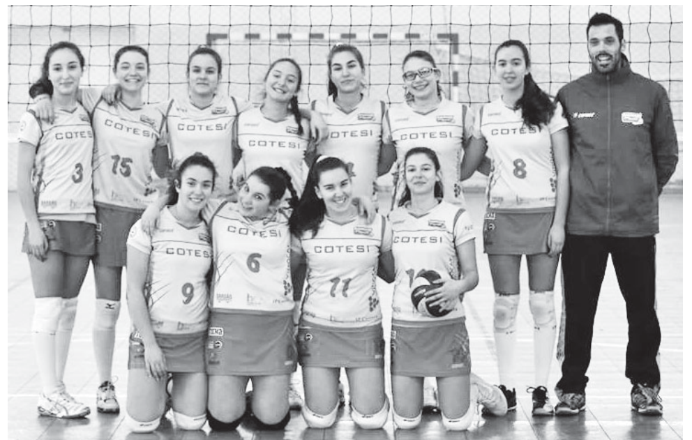
Juvenis da Academia José Moreira

assistiu-se a um bom jogo de voleibol. Com as equipas entregues ao jogo e a adivinhar-se uma 'negra', ou seja um jogo desempatado pelo quinto set, no quarto parcial o encontro acabou por pender a favor da equipa da casa, a Académica de S. Mamede, devido a uma série de más decisões da arbitragem. Mesmo com esta derrota, os objetivos dos juniores academistas continuaram inalterados e a serem perseguidos jogo a jogo.