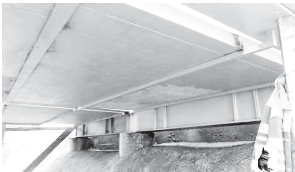
A Refer está a reparar a passagem pedonal no Rio Largo