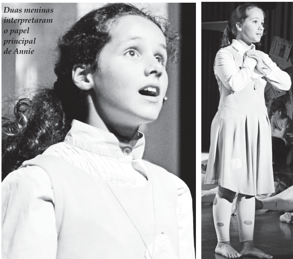
Duas meninas interpretaram o papel principal de Annie

A comédia musical é feita da música de Charles Strouse e com o libreto de Martin Charnin, a partir do livro de Thomas Meehan. Em 1982, foi adaptada para cinema. Este ano, estreou um "remake", que conta com Jamie Foxx e Cameron Diaz no elenco