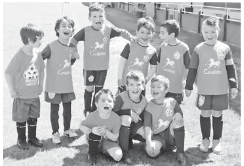
Traquinas e petizes do Sporting Clube de Silvalde/Marfoot