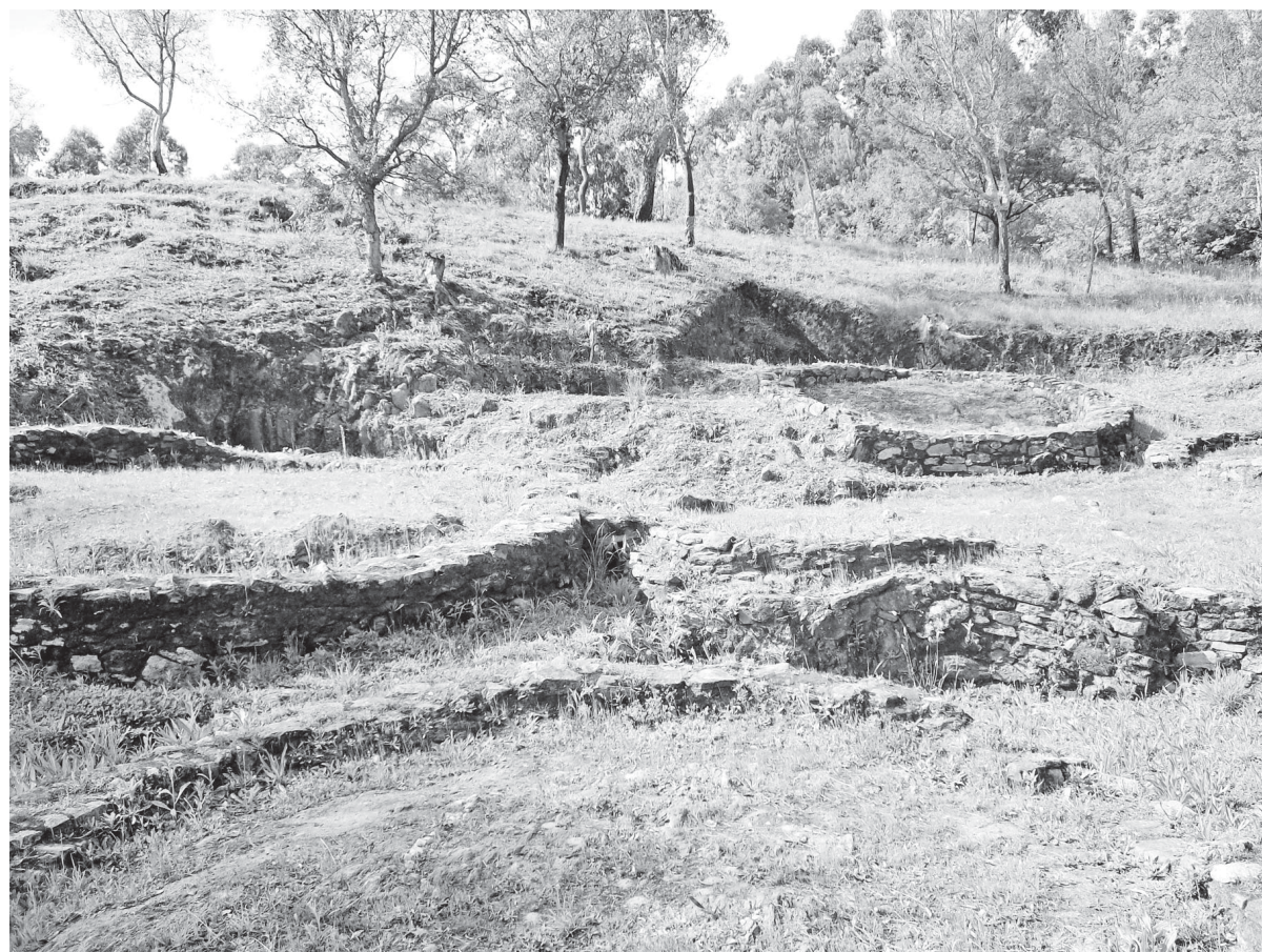
Imagens do Castro de Ovil e da Fábrica do Castelo (também em ruínas)