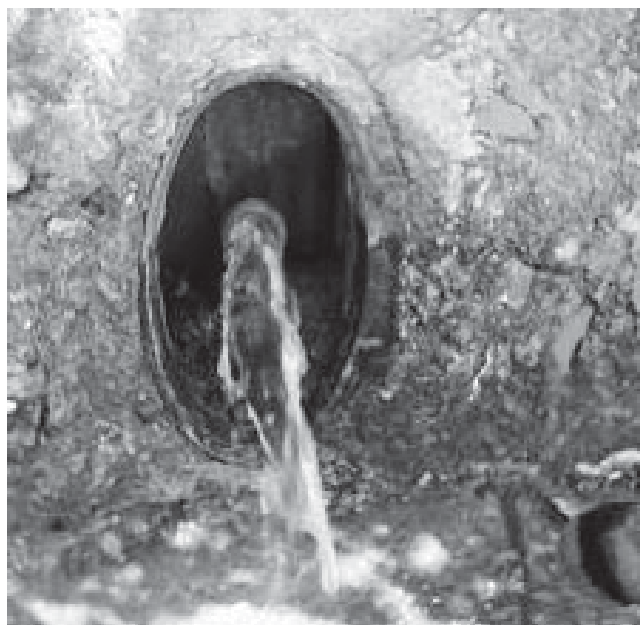
Água a deitar... para Rua do Porto, em Anta!