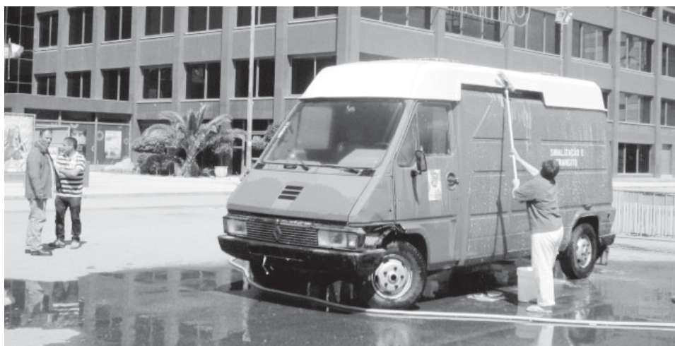
Imagem e comentário de Carlos Moleiro, reformado de 70 anos e natural de Espinho.