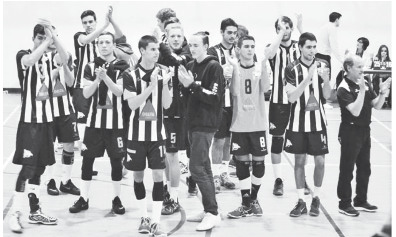
A equipa de juniores masculinos do Sporting Clube de Espinho estreou-se no Nacional com uma vitória por 3-0 sob o atual detentor do título, o Esmoriz Ginásio Clube