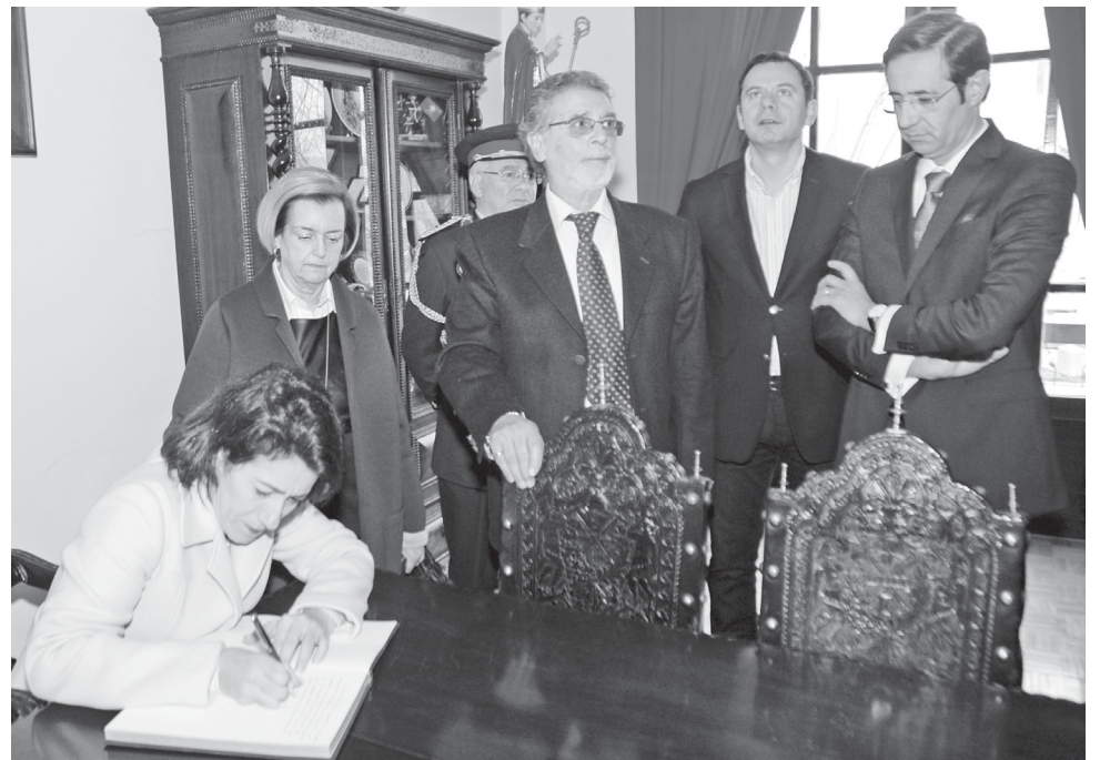
A ministra Constança Urbano de Sousa assina o livro de honra da Associação Humanitária dos Bombeiros Voluntários do Concelho de Espinho