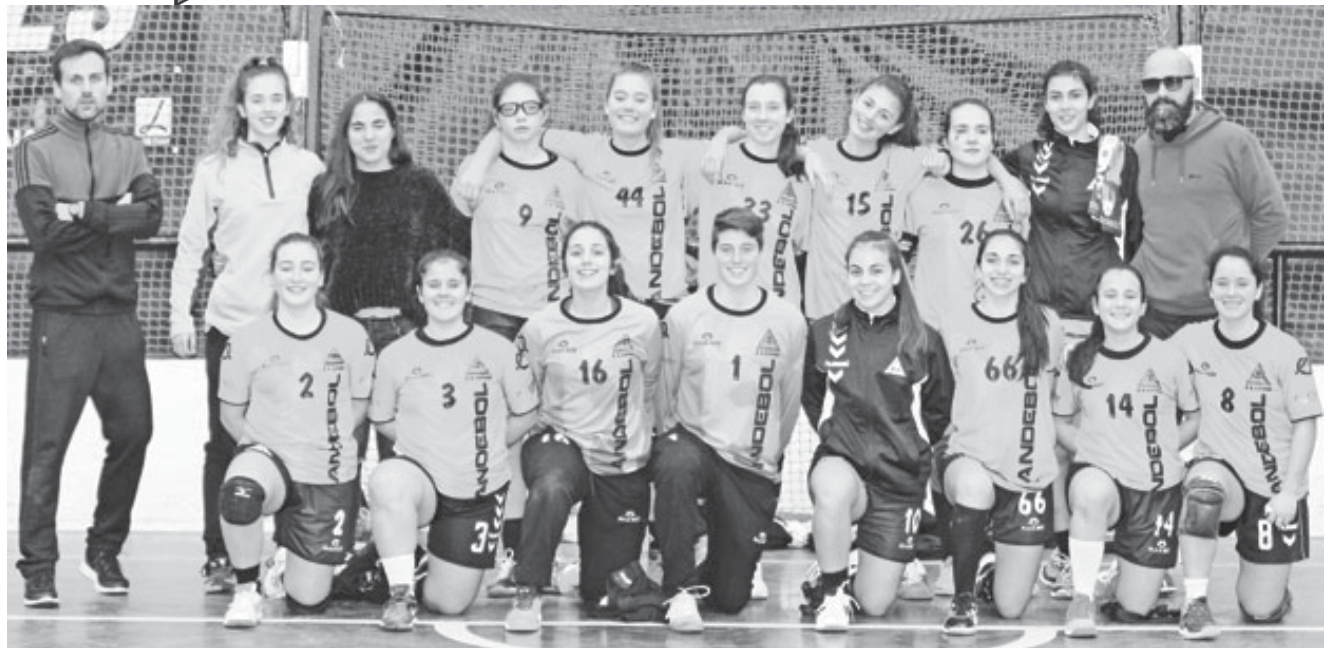
As juvenis da Académica de Espinho entraram na segunda fase do Campeonato Nacional com uma vitória por 36-12 ante o S. Pedro do Sul