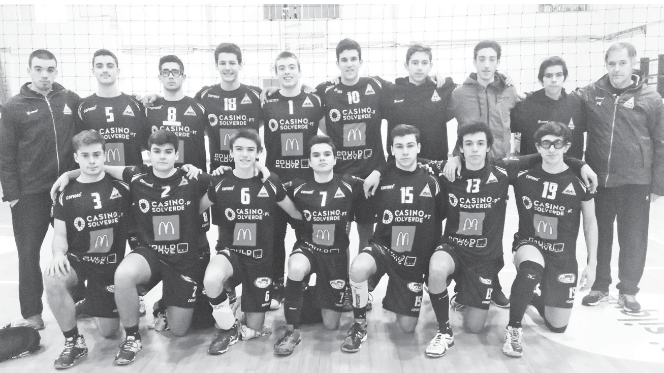
Os juvenis da Associação Académica de Espinho cederam, na 'negra', ante o Esmoriz

Entretanto, os infantis da Associação Académica de Espinho, deslocaram-se a Vila Nova de Gaia, para jogar com o Clube