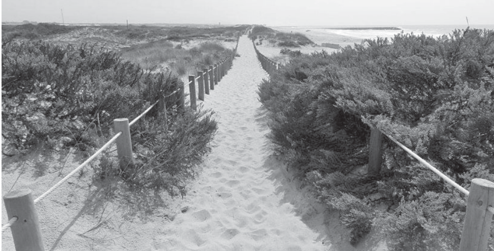
Os passadiços entre Paramos e Silvalde estão coberto de areia