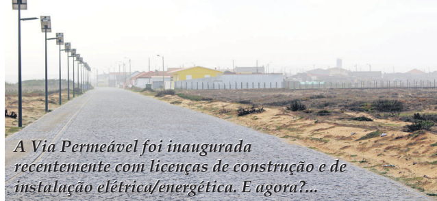
A Via Permeável foi inaugurada recentemente com licenças de construção e de instalação elétrica/energética. E agora?...

A Agência Portuguesa do Ambiente prevê demolição de 34 edifícios entre Caminha e Espinho. O novo Plano para a Orla Costeira põe em causa as habitações da comunidade da Praia de Paramos com centenas de residentes. O Ministério do Ambiente anunciou que o documento, no qual é proposta a destruição de 34 edifícios, entra já em período de discussão pública.