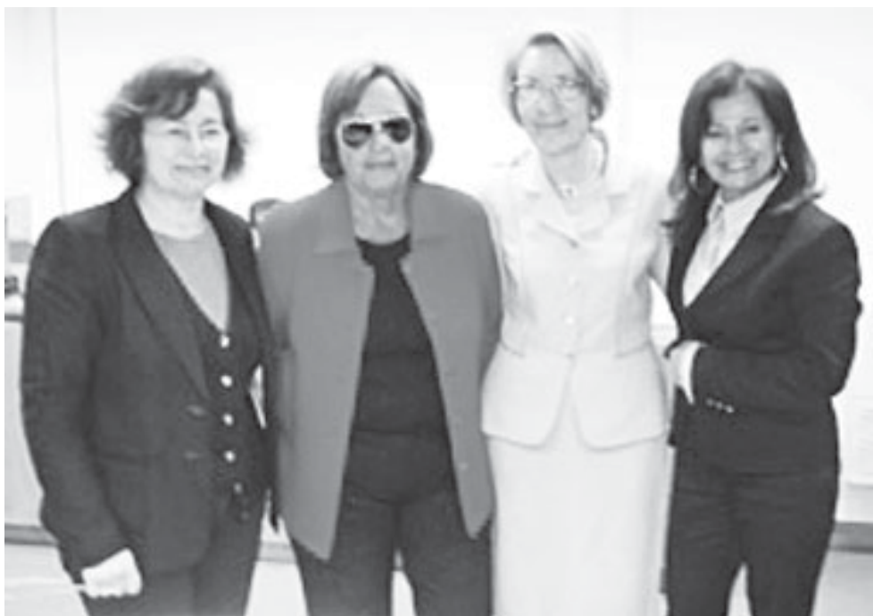
Lançamento da revista n.º 2 da Associação Mulher Migrante em 2013 na Escola Manuel Laranjeira