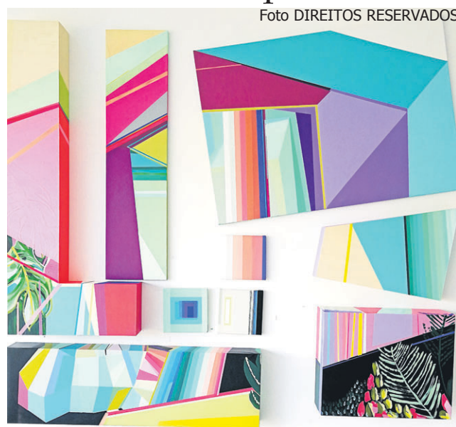
“Estamos a construir casa” - acrílico sobre tela e contraplacado marítimo

“Como artista plástica espinhense com residência artística no Fórum de Arte e Cultura de Espinho e apoiada pela Câmara Municipal de Espinho através desse protocolo, é com muito orgulho e entusiasmo que vejo o meu