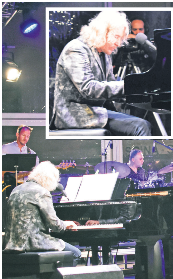
Marcos Valle com a Orquestra de Jazz de Espinho junto à Piscina Solário Atlântico

Mas, a programação deste último fim-de-semana arranca já nesta quinta-feira com o Planetário do Centro Multimeios a ser palco de uma viagem em que a música interpretada ao vivo e a projeção de imagens do espaço marcam o 50.º aniversário da chegada do Homem à Lua. O público é convidado a entrar num caleidoscópio imersivo em que a música de Steve Reich interpretada pelo Espinho EPME Ensemble se fundirá com projeções progra-