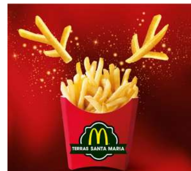
S. JOÃO DA MADEIRA SANTA MARIA DA FEIRA LOUROSA ESPINHO