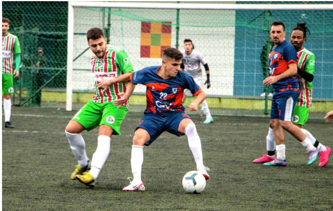
Ao derrotar os Morgados de Paramos, a AD Guetim passou para a liderança da tabela da 2.ª Divisão

Os guetineses assumiram a liderança com a vitória ante os Morgados por 1-3, alcançando a vantagem de um ponto sobre o Desportivo da Ponte de Anta e Bairro da Ponte de Anta, equipas que empataram (1-1), respetivamente, com a Associação de Esmojães e Estrelas Vermelhas. Nos restantes jogos, o GD Outeiros venceu o GD Idanha por 2-3 e a Lomba de Paramos empatou (1-1) com os Estrelas da Ponte de Anta. O primeiro lugar da classificação não é uma novidade para turma de Guetim. A posição é reforçada por