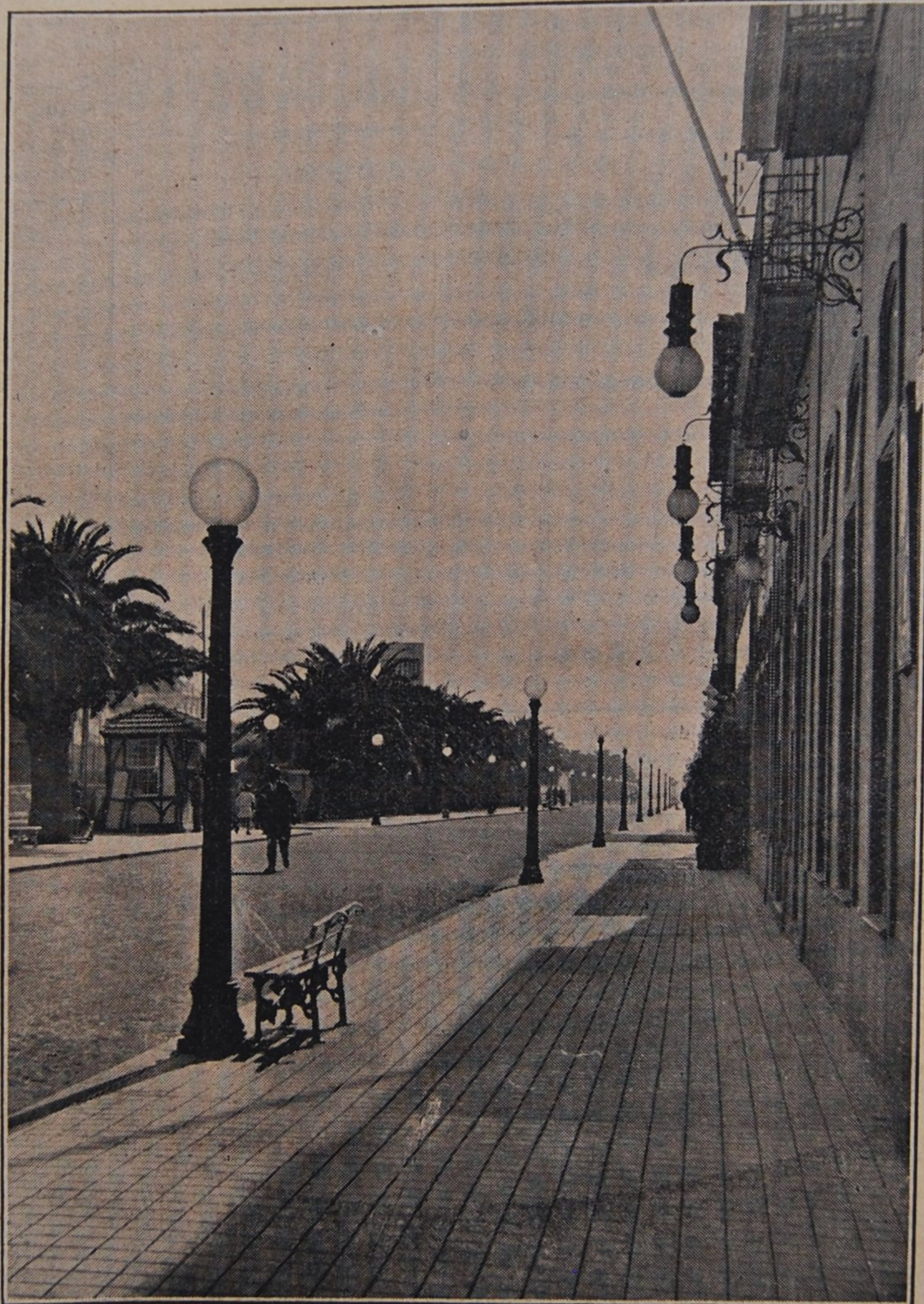
Um trecho da Avenida 8 (parte ponte, lado sul)

A praia de Espinho é das terras do País que mais sacrificada tem sido aos caprichos da Natureza, e onde, por vezes, mais estragos têm feito as conseqüências de crises de origem varia.