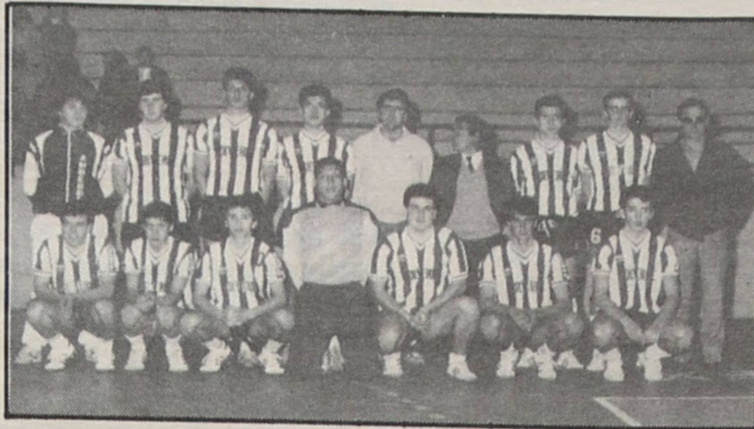
Equipa de juvenis – novo regulamento da prova impossibilitou ir mais além.

não conseguiu manter o nível exibicional e foi perdendo jogos atrás de jogos, cedo se afastando dos lugares que davam acesso ao escalão secundário. Os jogadores davam mostram de cansaço e sem poder anímico para reagir a situações desfavoráveis.