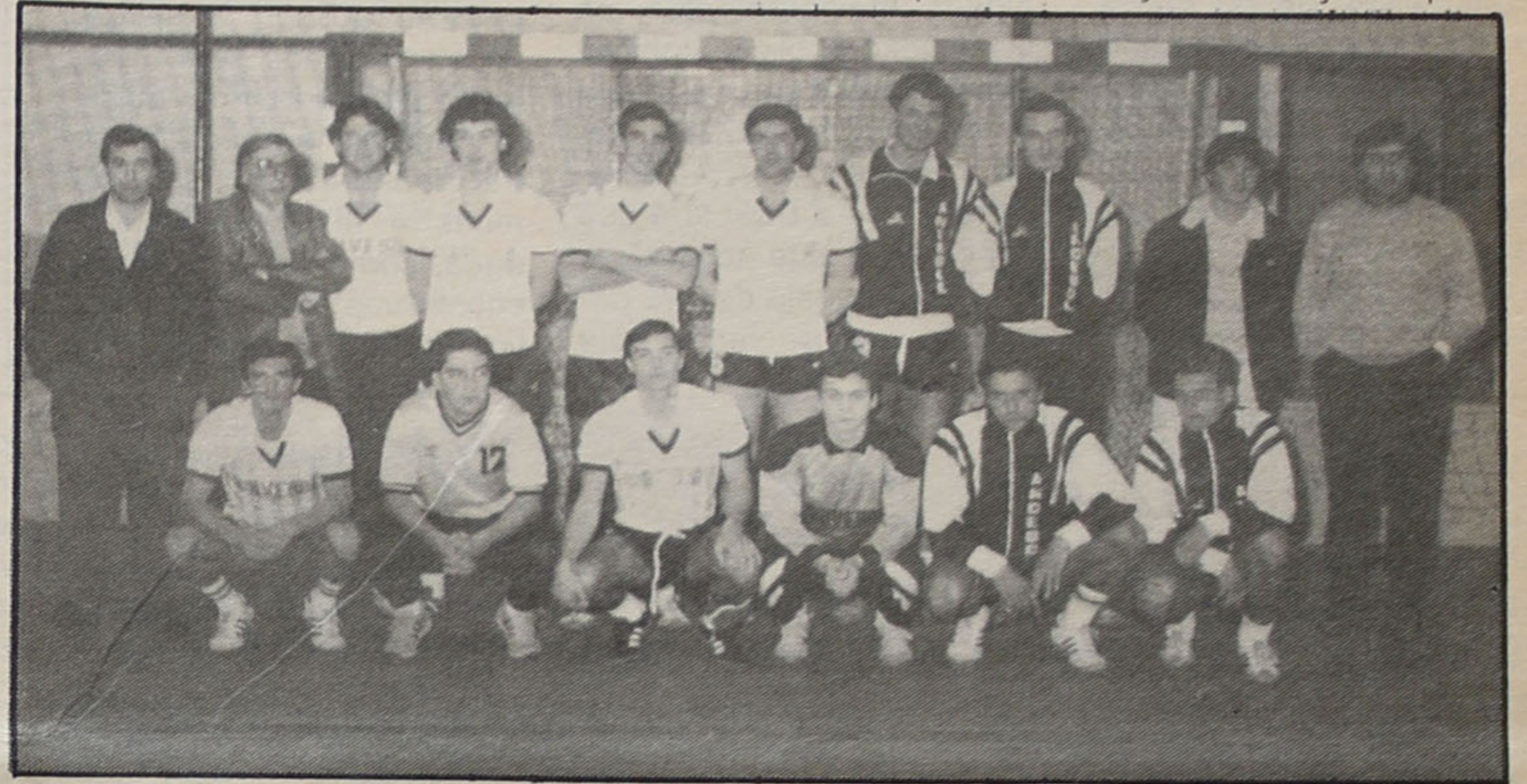
Equipa de seniores – uma vez mais a subida de divisão não passou de um sonho.

Finalmente ainda mais umas palavras para o escalão de juvenis. Facto inédito na história do clube, pelo menos não temos conhecimento que já antes tenha acontecido, foi a internacionalização alcançada pelo