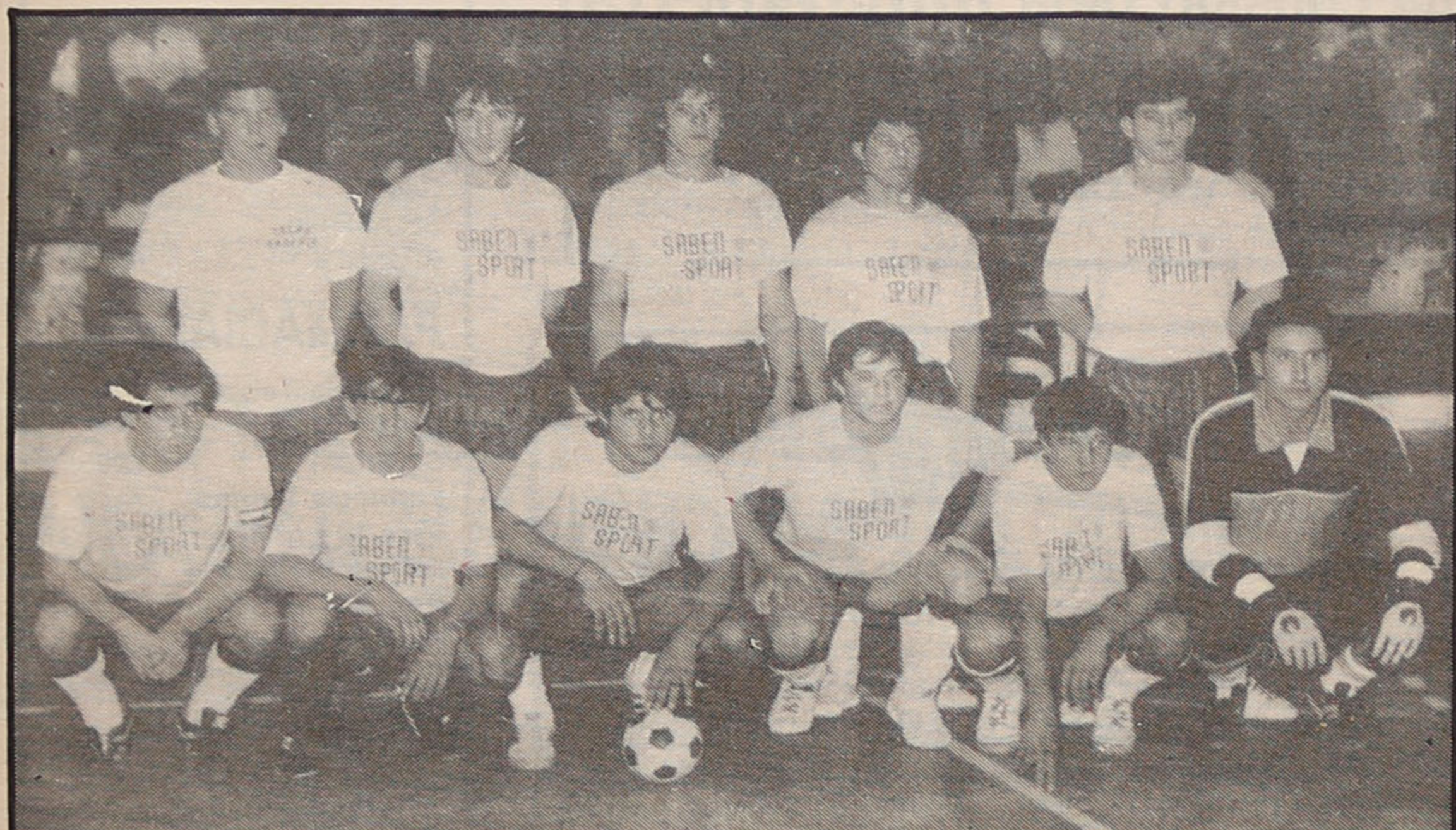
VENCEDORES DO XIX TORNEIO DE FUTEBOL DE SALÃO DA A.A.E.