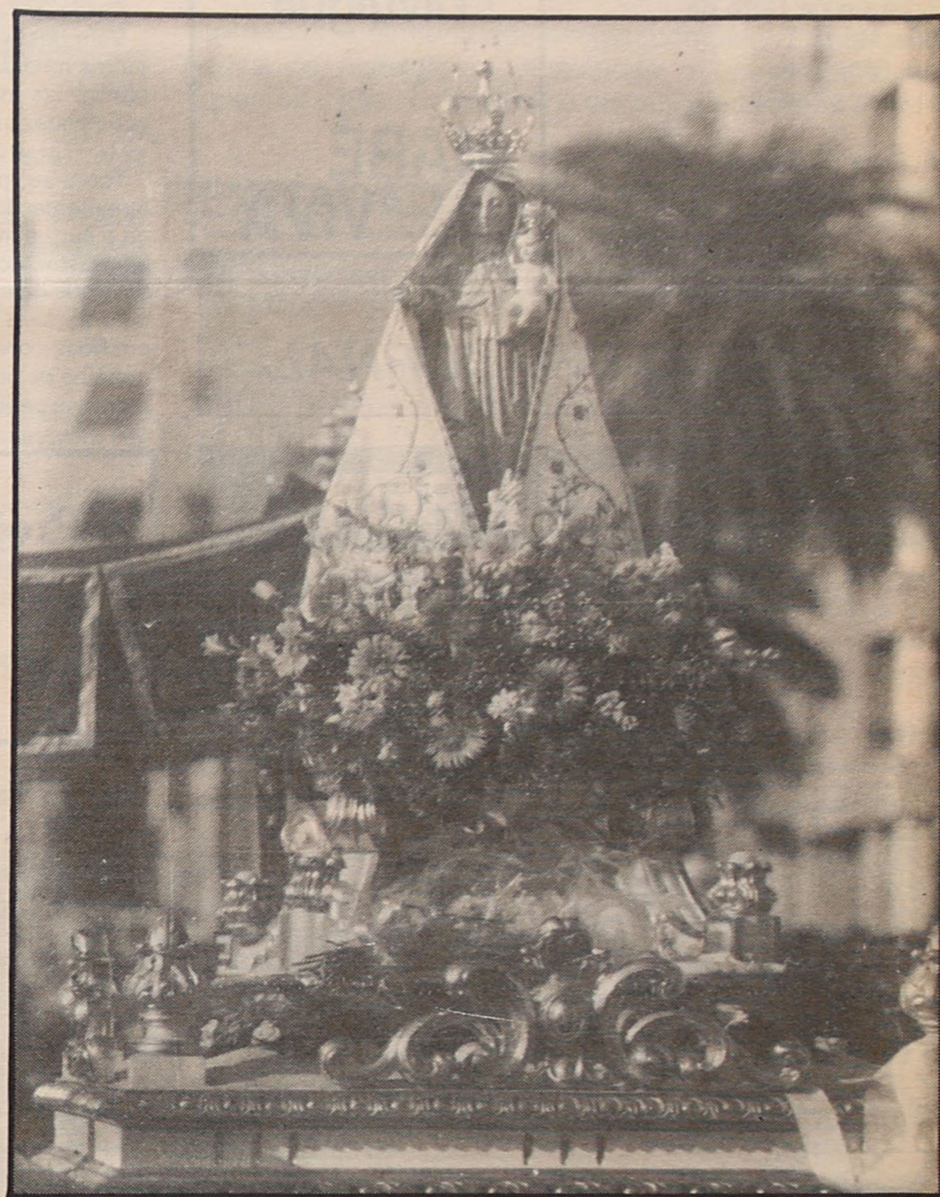
ANDOR DA N.ª SENHORA D'AJUDA