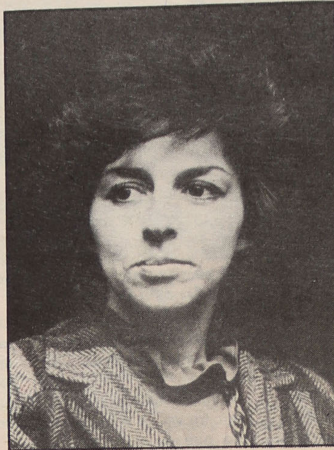
MINISTRA DA SAÚDE

Tudo faz crer que se vai perder o orgulho de poder dizer que somos "nados e criados" em Espinho porque não está longe o dia em que só se poderá afirmar ter sido criado nesta terra de Espinho porque nascer... isso será em qualquer outro lugar, sem excluir a possibilidade de ser numa ambulância.