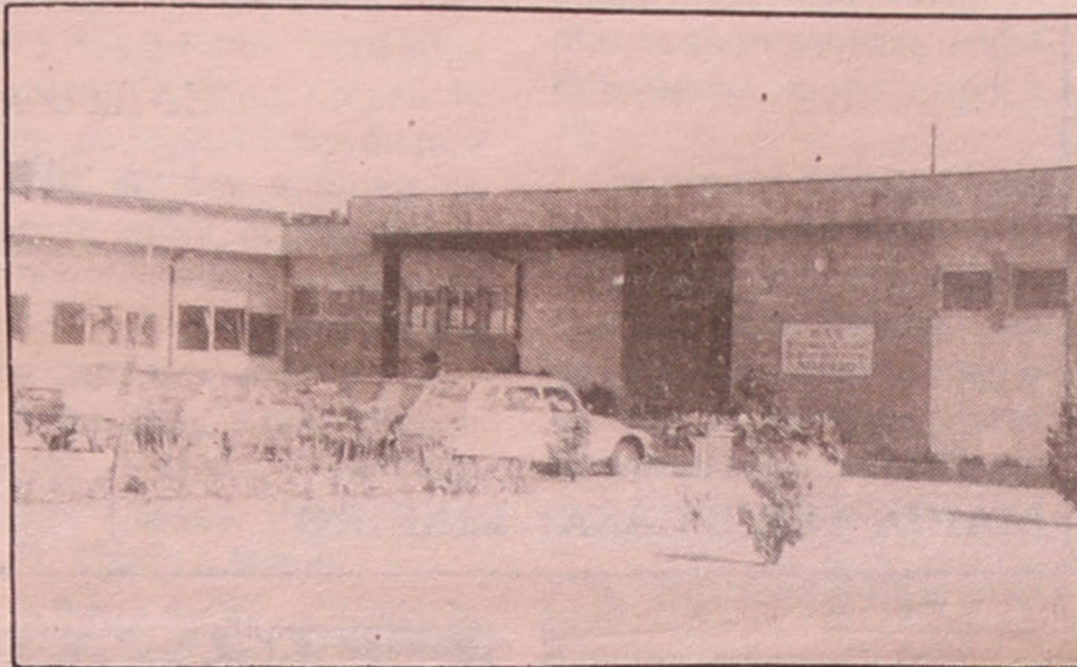
Centro Infantil de Espinho 2

Ao contrário do que aconteceu na maioria dos estabelecimentos de ensino, no Centro Infantil a data foi comemorada nas próprias instalações,