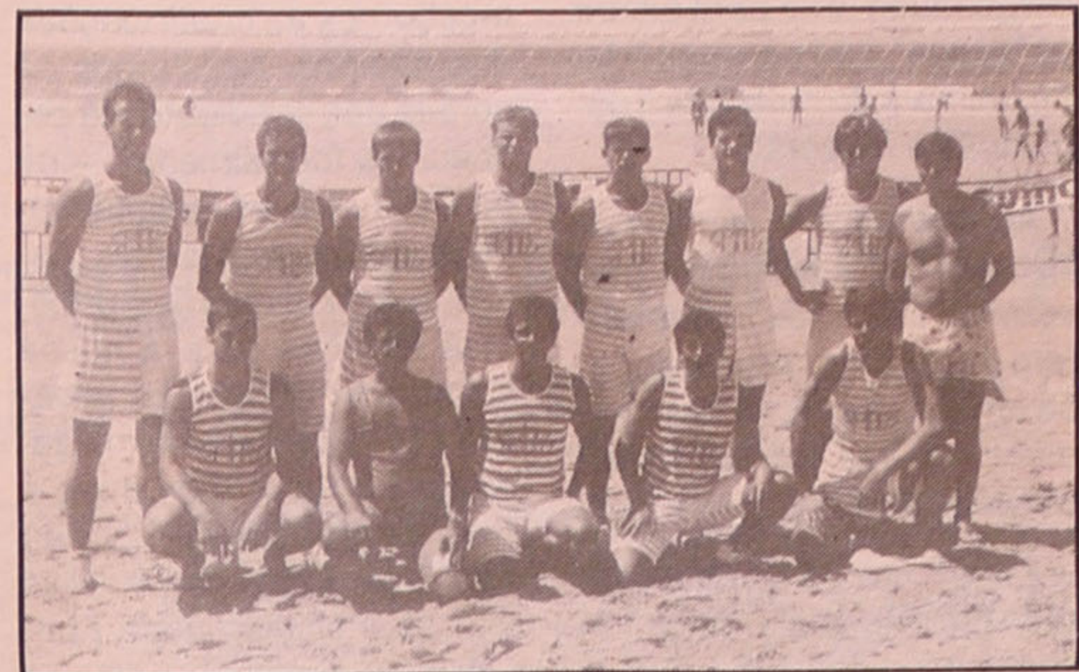
A formação de "Spinus" que venceu o Torneio Internacional da Costa da Caparica.