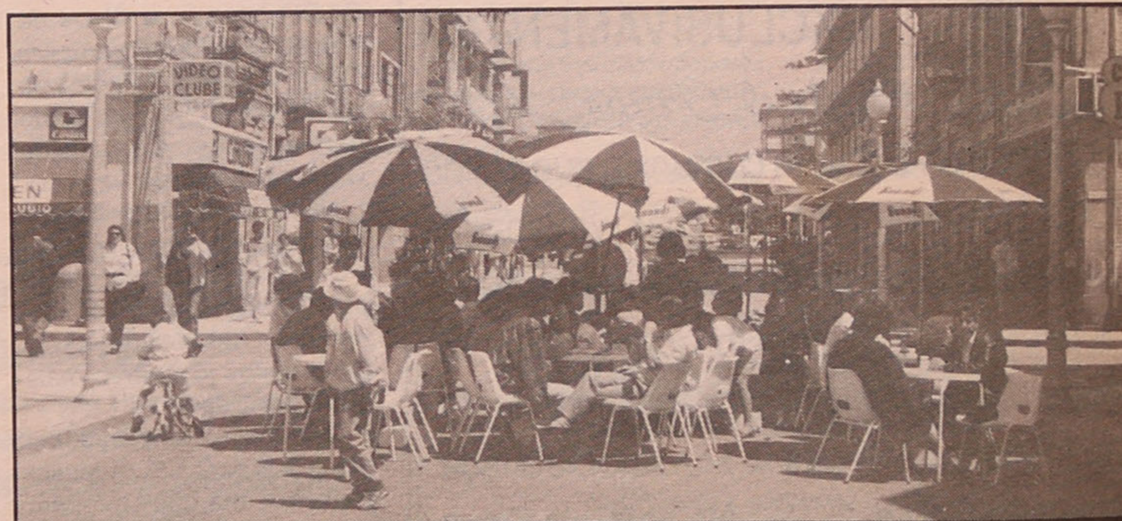
AS OBRAS MELHORAM ESTA IMAGEM

Que sejam retomadas no momento mais apropriado e com melhor coordenação dos trabalhos é o que se tem de esperar.