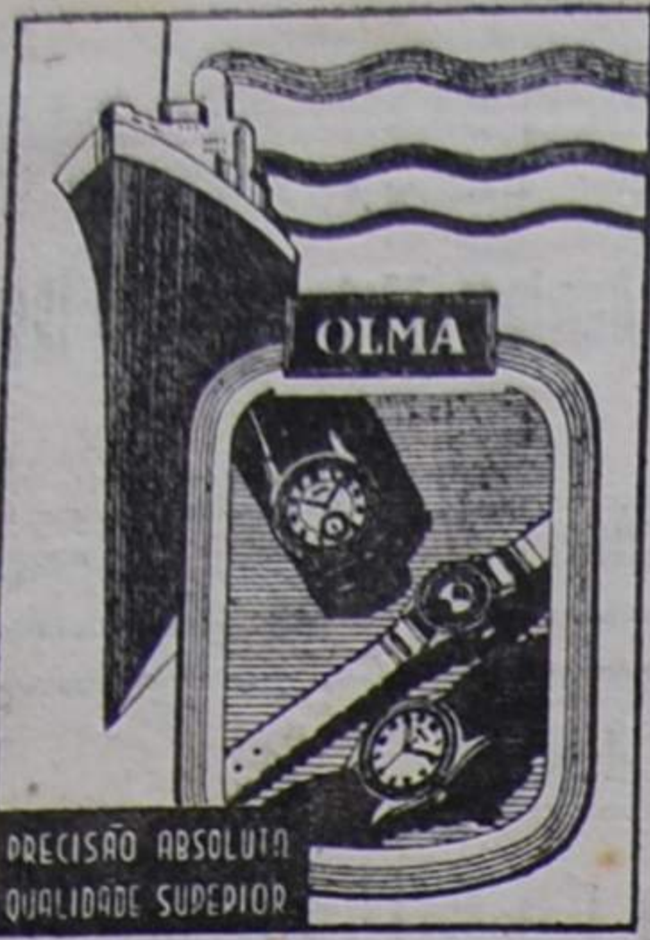
PRECISÃO ABSOLUTA QUALIDADE SUPERIOR