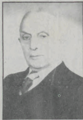
À família enlutada «EV» apresenta o seu pesar.

Foi vereador da Câmara Municipal logo a seguir ao 25 de Abril.