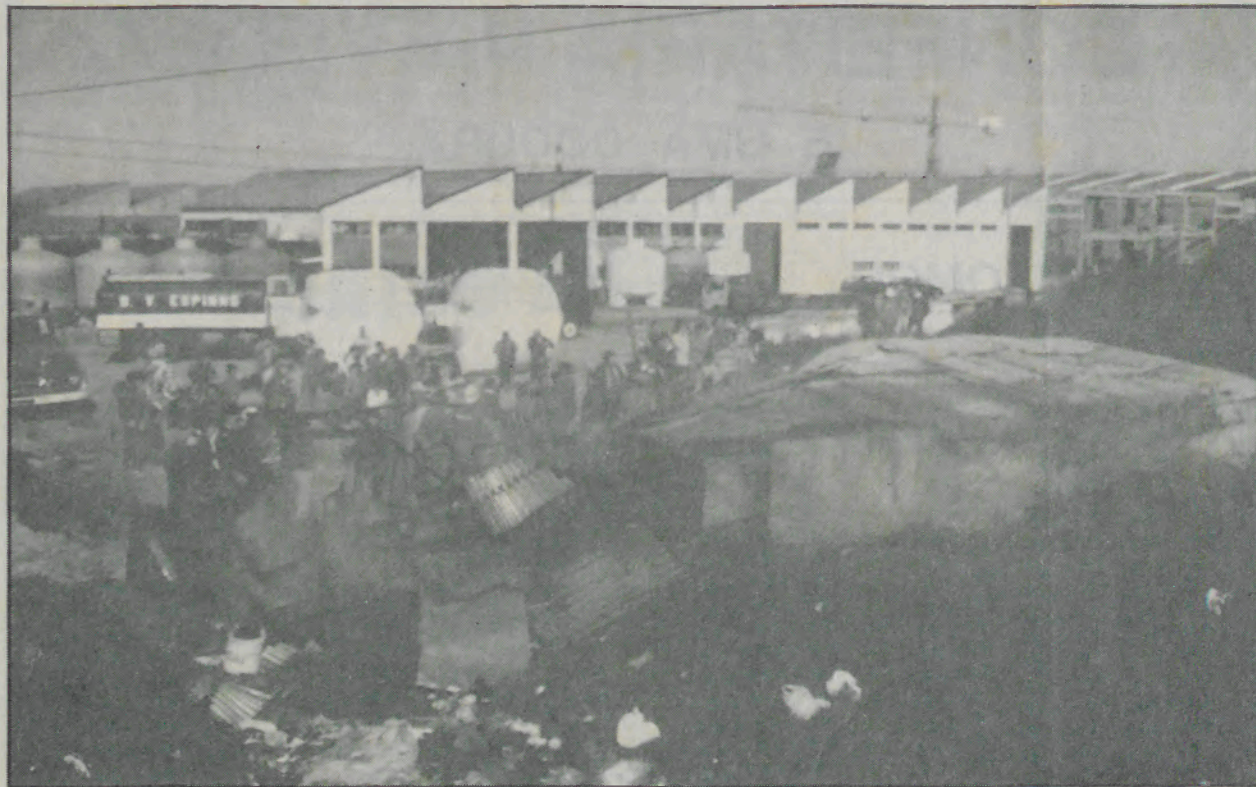
Paredes meias com uma unidade fabril o mísero barraco onde aconteceu a tragédia.

Museu Marítimo e Reg. de Ilhavo 3830 Ilhavo