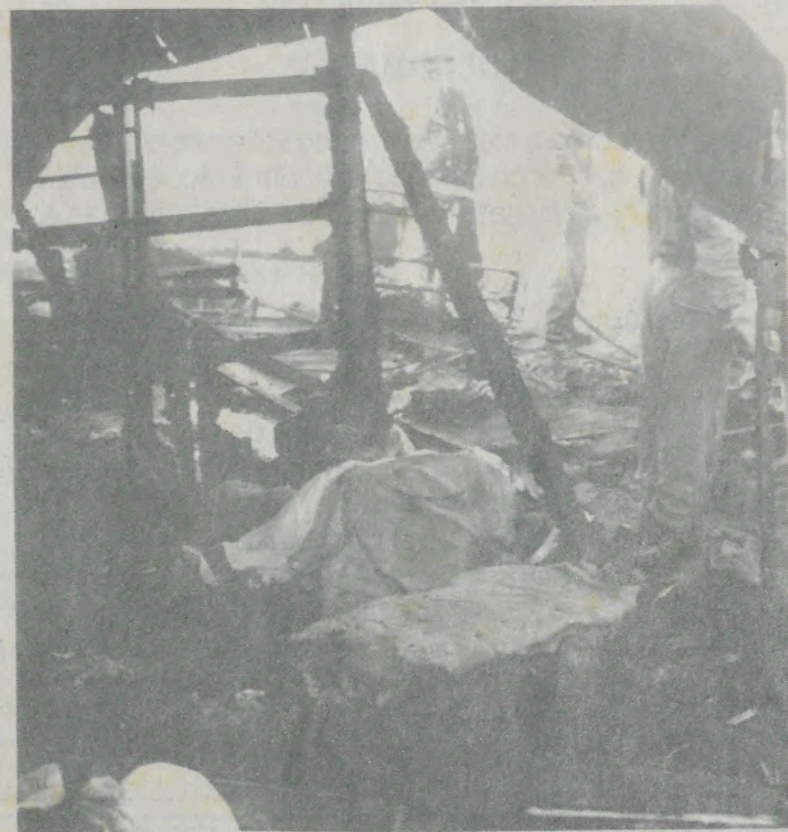
Cobertos pelos panos os corpos dos dois irmãos

Para além da emoção que causou em muitas dezenas de populares que compareceram para ver o sinistro, o caso foi motivo de violentas críticas à Câmara Municipal que tarda em resolver estas situações terceiro-mundistas que têm dentro da Cidade.